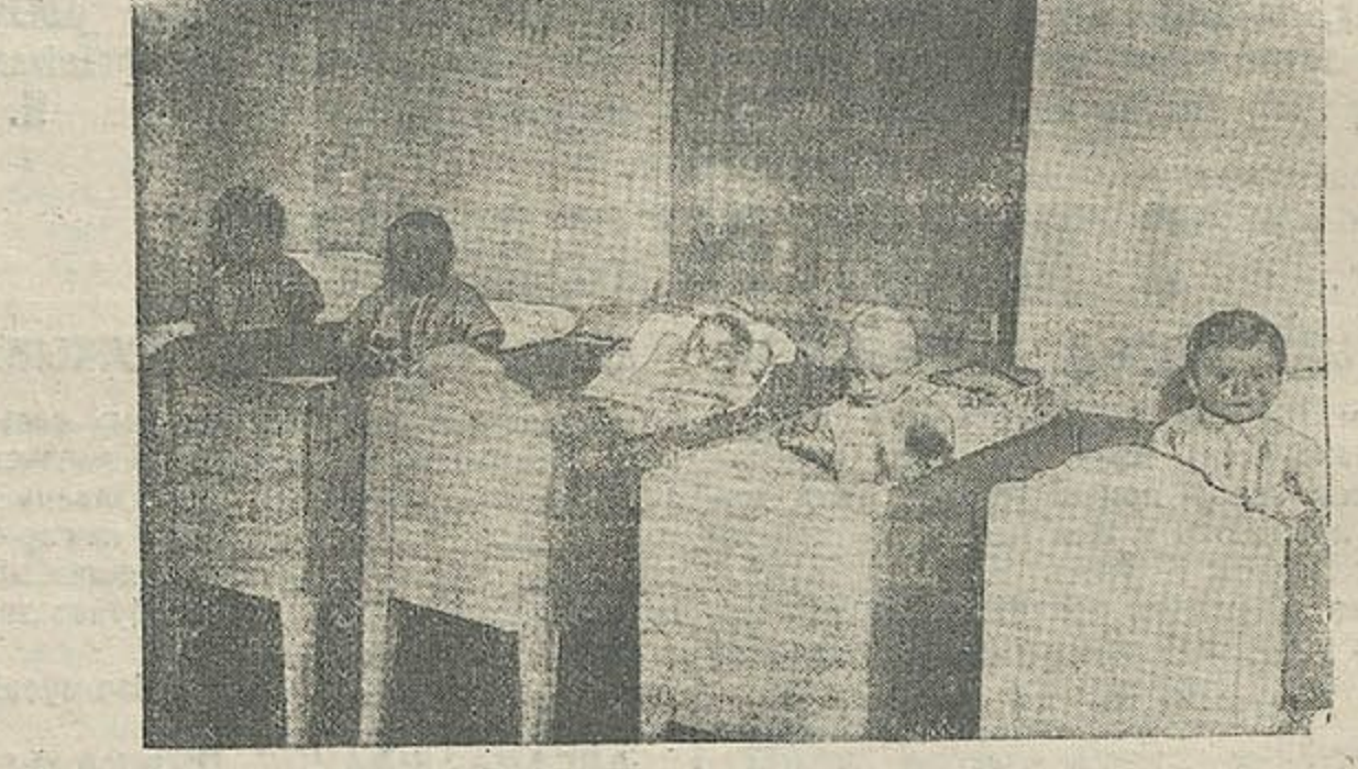
дзятчына яслі (імя „Чырвоны Сьцяг“ на Віцебшчыне).

Увага. Некалькі слоў аб мінулым. Аб мінулым камуны Карла Лібкнэхта. Увага.