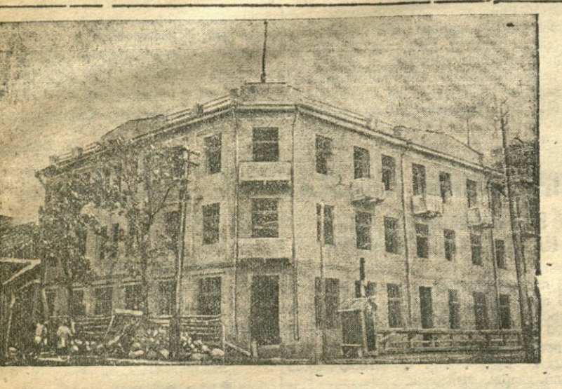
Ком. пабудаваных вамагасам у Воршы, дзе будучы змяшчаны кватэры, рабочыя атаманы і магазін ЦРК.

Бясспрэчным з'яўляецца факт, што сёння ў Бабруйску разгорнута будаўніцтва. Аб гэтым гаворыць распачата пабудова многіх будынкаў, аб гэтым гавораць і будыні, пабудова якіх дасягнула скончэння. Але таксама бясспрэчным з'яўляецца і той факт, што будаўніцтва ў Бабруйску і ў некаторых мясцох у акрузе ідзе дрэнна. Мінута паслова і аперуе, а некаторы будыні яшчэ не распачылі будаўніцтва.