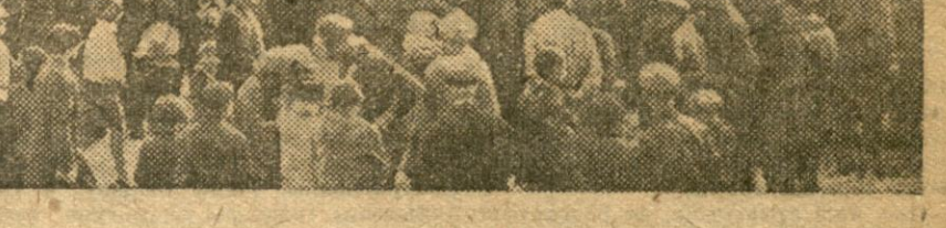
У дзень 1-га Мая на Плянх Волі ў Менску.

Цэнтральны Камітэт КП(б)Б абвясціў м'ясцамі для самакравяры зямляздрыгаў. Але, як гледзячы на вынікі палітычнае зглянення гэтага маршэрскага сістэма, Копыцкі райком КСМ гэтым пытаннем ніяк не зааімаваў. Южкоўскі рух на Копыцкім раёне ў яго не.