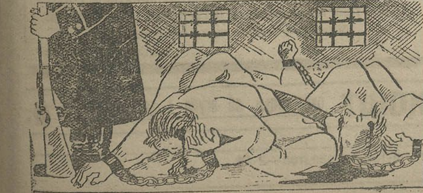
І ШІХА БЫЛО У ВАСТРОЗЕ...