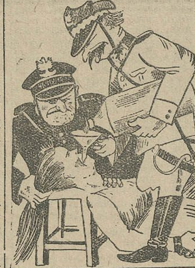
Пачуўся крык з жаночай камеры...