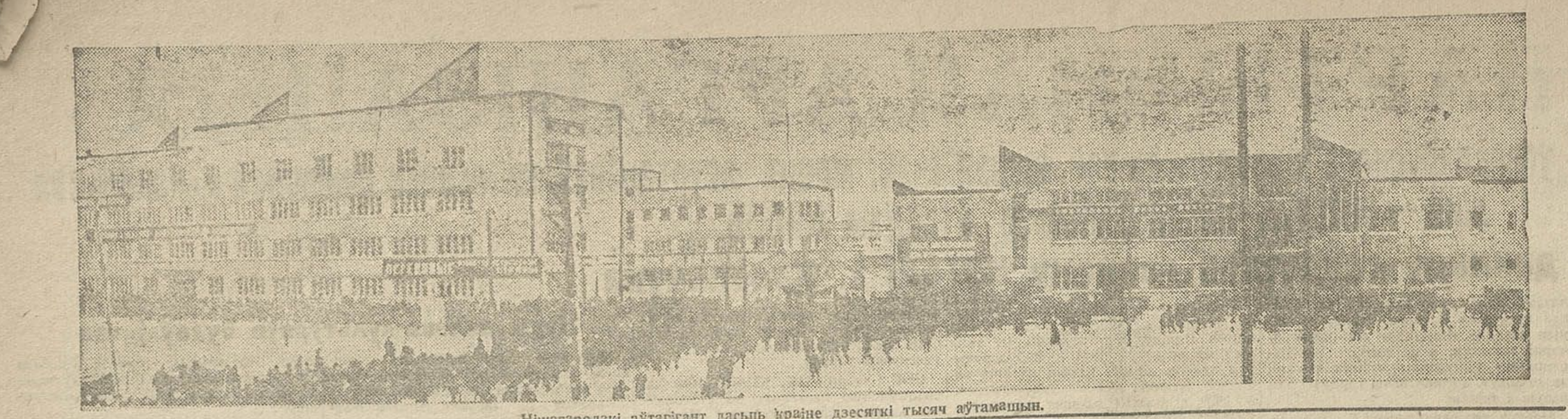
Ніваградскі аўтагігант дасьць краіне дзясяткі тысяч аўтамабіляў.

Удзельнікі лясной прамысловы патрабуюць ад гаспадарнік чоткай работы. Удзельнікі лясной прамысловы патрабуюць ад гаспадарнік чоткай работы. Удзельнікі лясной прамысловы патрабуюць ад гаспадарнік чоткай работы.