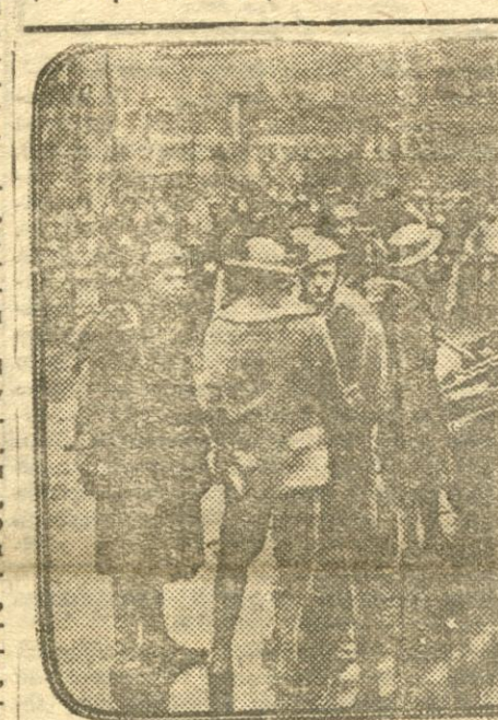
Атрад амерыканскіх маракіаў на вуліцах Шанхаю

ВАРШАВА. 22-III. Сёння ў Львове стрэлаў з рэвалверу забіты мэр вуліцы камісар палітычнай паліцыі ЧАХОУСНІ. У забойстве падарожнаў членаў украінскай ваеннай арганізацыі. Праведзены арышты.