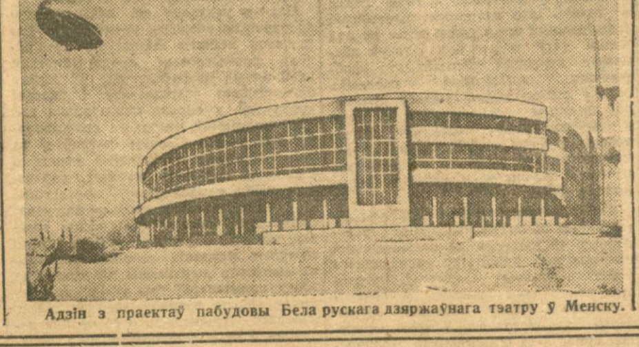
Адзі з праектаў пабудовы Беларускага дзяржаўнага тэатру ў Менску.