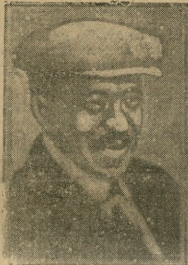
Командир «Красина» проф. Самойлович

«Катастрофа «Италии» произошла 24-го мая. 30-го мая Мальгрена, Дзаппи и Мариано пошли в Бай-Норт, где надеялись встретить советских промышленников. У Мальгрена была сломана левая рука. Дзаппи рассказывает: «Во время похода мы терпели большие лишения. 16-го июня Мальгрена не был в состоянии продолжать путь и сказал, чтобы мы отправились дальше один, забрав с собой все наличное продовольствие. Мальгрена просил предварительно вырыть ему могилу во льду, куда он лег. Мы пошли. Когда мы были в 100 метрах, то видели, как Мальгрена поднимал голову. Надеюсь, что побуждаемый голодом он пойдет за нами, стали звать его. Увидя это, Мальгрена закричал: «Идите. Ценой моей жизни вы спасете остальных». Мы пошли дальше.