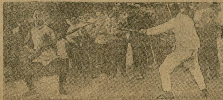
На всебелорусской спартакиаде. — Фехтовальщики частой ОБВМ

Газоокуривание под руководством ЦС Осоавиахима БССР будет проводиться в течение всей недели обороны.