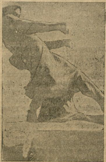
Премиированная работа ученика 2-го курса витебского художественного техникума

Витебск, 16. (От наш. корр.) Закрылась отчетная выставка работ студентов художественного техникума. На выставке были пред-