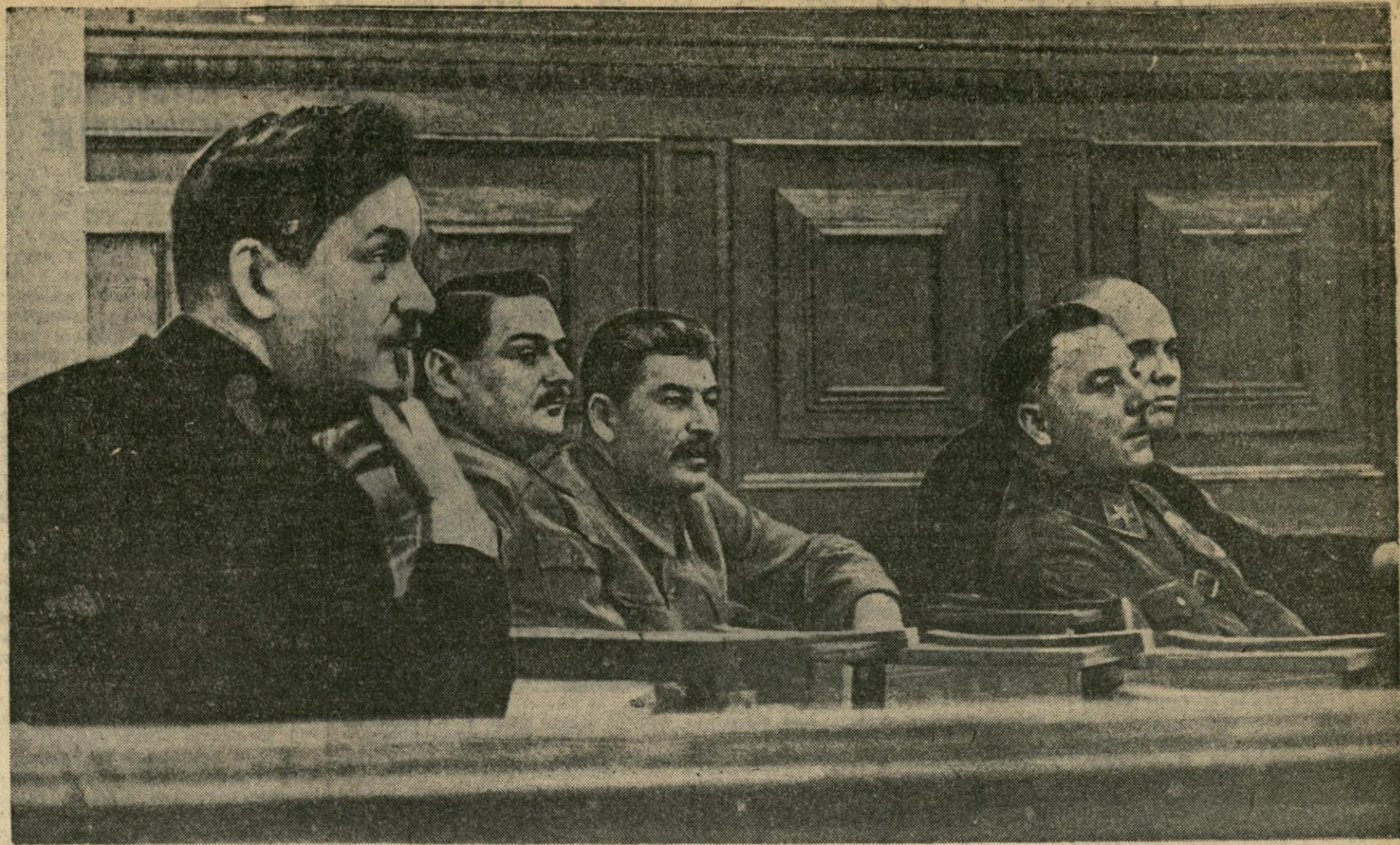
Депутаты Верховного Совета СССР (слева направо): товарищи Н. А. БУЛГАННИН, А. А. ЖДАНОВ, И. В. СТАЛИН, К. Е. ВОРОШИЛОВ и Н. С. ХРУЩЕВ на заседании первой Сессии Верховного Совета СССР. (Январь 1938 г.).

Пройдут века. Потомки наши будут с благодарностью вспоминать о Первой Сессии Верховного Совета СССР, вписавшей славную страницу в историю развития социалистического общества, будут изучать принятые законы и постановления — несравненные образцы подлинно народного законодательства, отражающие все величие и мощь первого в мире социалистического государства рабочих и крестьян.