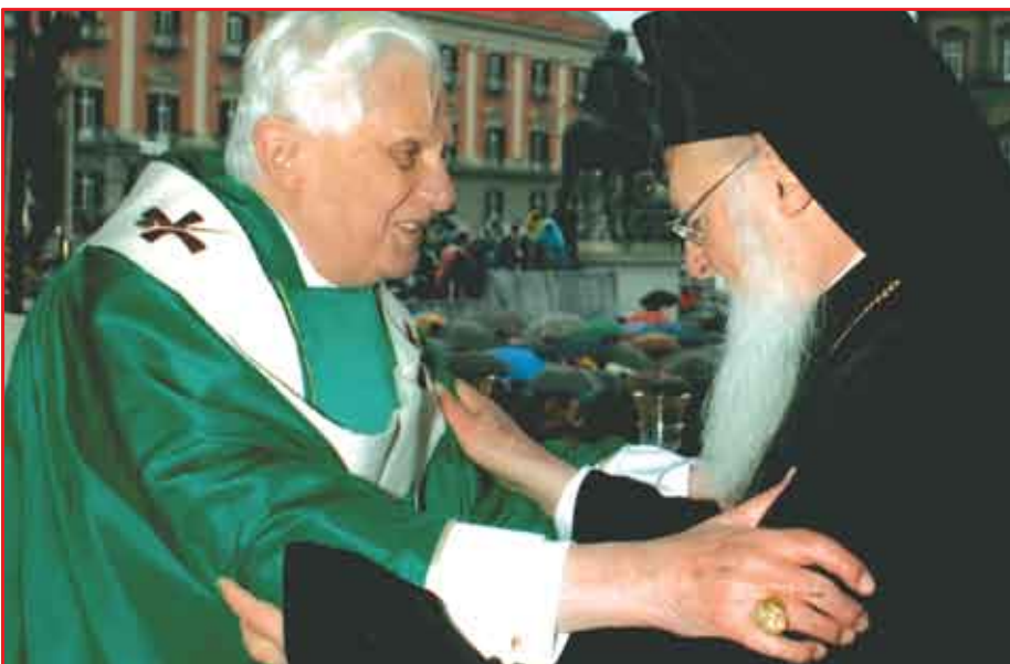
● 21.10.2007 г. Неапаль Папа Бенядыкт XVI і Патрыярх Бартламей I

ТЫДЗЕНЬ МАЛІТВАЎ ЗА ЕДНАСЬЦЬ ХРЫСЬЦІЯНАЎ 18 — 25 студзеня 2008 г. .... с. 20