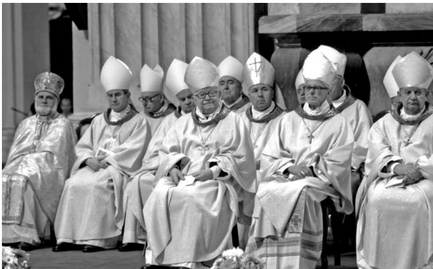
● 27.10.2007 г. Рым Базіліка сьв. Яна на Латэране. Яракі ўдзельнічаюць у беатыфікацыі бл. Цэліны

Маці Цэліна Бажэнцкая, народжаная ў Беларусі, была жонкай, маці, удавою і манахіняй. Прайшла праз усе этапы жыцьця жанчыны. Таму для ўсіх жанчынаў яна можа быць узорам клопату пра хрысціянскае і патрыятычнае выхаваньне маладога пакаленьня.