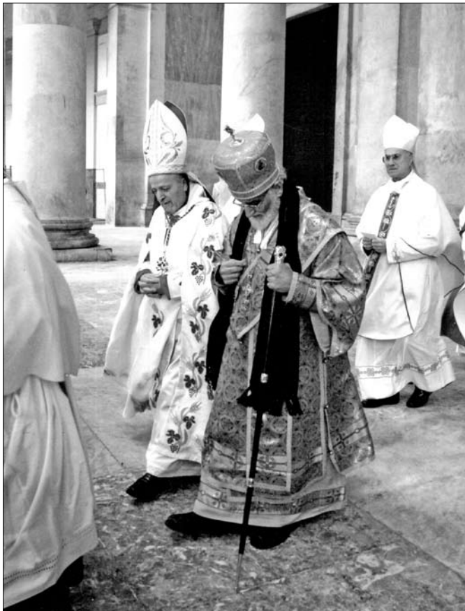
● 21.10.2007 г. Неапаль Патрыярх Ігнат Майсей I Дауд і Патрыярх Рыгор III з правага боку

21-23 кастрычніка 2007 г. ў паўднёва-італійскім горадзе Неапаль праходзіла Міжрэлігійная Сустрэча «За сьвет без насільля: Рэлігіі і культуры ў дыялогу». Яе арганізавалі рыма-каталіцкая архідыяцэзія Неапаль і Супольнасьць сьв. Эгідыя (Comunità di Sant'Egidio). Удзел у Сустрэчы ўзялі высокія прадстаўнікі хрысціянскіх Цэркваў, а таксама сусьветных рэлігіяў.