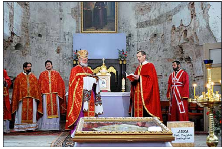
• Вільня, 14.11.2009. Літургія ў памяць сьв. Язафата ў царкве Святой Тройцы.