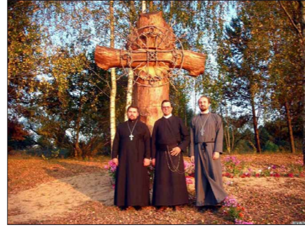
• 27.09.2009. Урачыстасці асвячэння крыжа ў в. Салацьце Гарадзенскага р-ну.