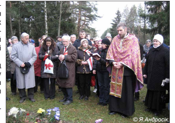
• Памінальная малітва ў Курапатах.