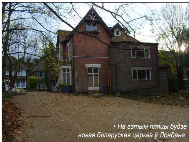
• На гэтым пляцы будзе новая беларуская царква ў Лондане.