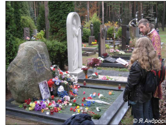
• Малітва ля магілы Васіля Быкава.

У той жа дзень айцец Пахом адслужыў Паніхіду ля мемарыяльнага крыжа