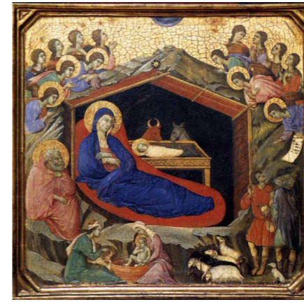
• Дуча ды Буонінсенья. РАСТВО (1308-11).

Бог стварыў чалавека на свой вобраз і падабенства (гл. Быц 1, 26-27; Ёў 10, 8) і, абдараваўшы яго такой славаю, пасяліў у месцы, якое адпавядала годнасьці чалавека – у Эдэме (гл. Быц 2, 8; 2, 15).