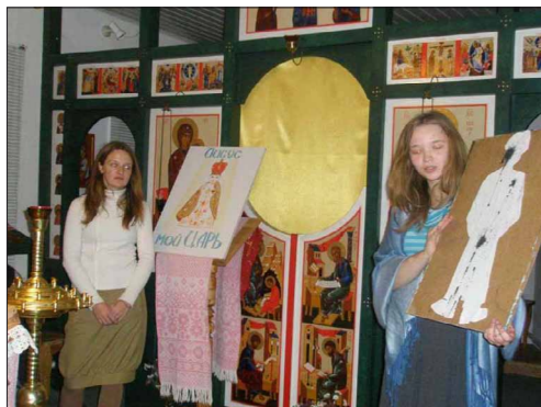
• Віцебск. Валанцёры з руху сьв. Мікалая праводзяць духоўна-малітоўную сустрэчу для непаўнаспраўных.