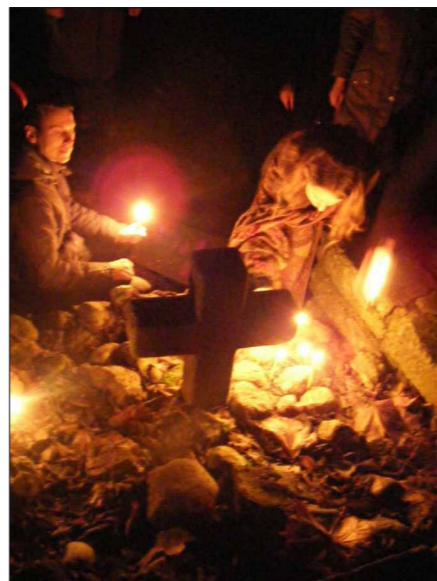
• Начное чваньне моладзі ў Віцебску.

На старонках «Царквы» мы вырашылі зьмяшчаць цікавыя думкі і выказваньні з «Жывога Журналу» ў інтэрнэце. Гэтыя думкі і перажываньні карыстальнікаў «ЖЖ», адшуканыя і падрыхтаваныя Надзеяй Ярмашынай, падаліся нам цікавымі і вартымі, каб пазнаёміць з імі іншых. У сваіх дзёньніках іх аўтары разважалі пра пакліканьне, малітву, пра грэх і пра сьвятасьць, пра любоў і пра ўдзячнасьць, пра прыгажосць. Розныя думкі. Можна ўздацца самога сябе і свой вопыт адноснаў з Богам і сьветам, што вакол нас. З імі можна пагаджацца ці спрабаваць аспрэчваць. Не судзіце строга. Бо адзінае, што аб'ядноўвае гэтыя выказваньні, – шчырасьць.