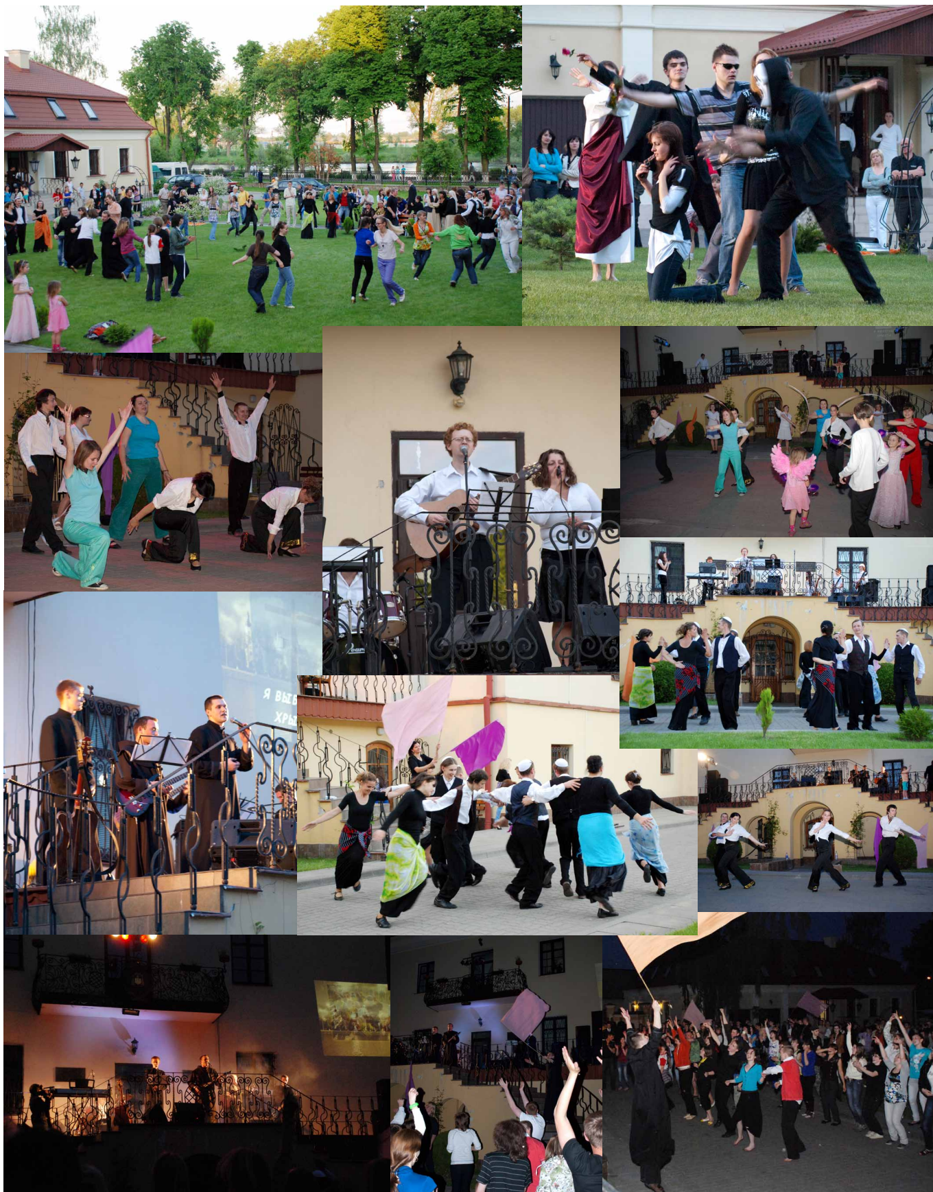
Хрысьціянскі фэст у Пінску напярэдадні сьвята Зыходу Сьвятога Духа, 22.05.2010.