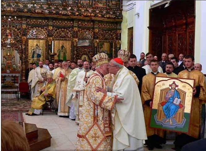
• Румынскія грэка-каталікі вітаюць Прэфекта Кангрэгацыі Ўсходніх Цэркваў кард. Леанарда Сандры ў катэдры г. Блаж.

Падтрымцы і ўмацаваньню еднасьці з Апостальскай Сталіцай грэка-каталіцкай супольнасьці ў Румыніі, а таксама ажыўленьню экуменічнага дыялогу з праваслаўнымі служыў візіт у Румынію 6-10 траўня 2010 году Прэфекта Кангрэгацыі Ўсходніх Цэркваў кардынала Леанарда Сандры.