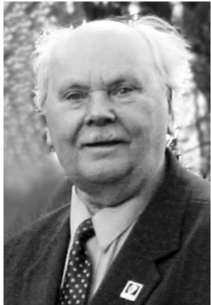
Міхась Канстанцінавіч Міцкевіч.

— Па сутнасці Якуб Колас настаўнік. Ён настаўнічаў, выхоўваў і падрыхтоўваў дзетак у першыя і сярэднія гады навучання ў пачатковых школах, таму адносіўся да іх вельмі і вельмі ўважліва. Адчуваючы, што не хапае матэрыялаў для іх навучання, Колас распрацоўваў свае метадыкі: і метадыку выкладання мовы, і ўвогуле метадыку навучання дзяцей. Ён прапрацаваў нямала крыніц, і кніжачка «Другое чытанне для дзяцей беларусаў» спецыяльна была ім падрыхтавана, каб дзеткі маглі ўспрымаць усё наваколле, бачачы і адчуваючы прыроду, усё тое, што адбываецца ў жыцці, ад самага пачатку, ад асновы той прыроды, у якой яны знаходзіліся. І канечне Якуб Колас ужо мэтанакіравана выбіраў і моўныя, і літаратурныя сродкі, каб дзеці лягчэй засвойвалі прадмет. На працягу ўсяго жыцця прагледжваецца яго пільная ўвага да школы і да школьнікаў, да мовы, каб яе вывучалі ў школах. Гэта было ў Коласа на працягу ўсяго жыцця. І ў публіцыстыцы, і ў вершах. Многа вершаў прысвечана дзецям і непасрэдна датычыцца дзетвары. Яны вельмі лёгка завучваюцца на памяць. Калі Якуб Колас займаўся справаю выкладання беларускай мовы, ён гэта пытанне дасканала распрацоўваў па розных метадыках. Трэба сказаць, што гэта значная навуковая праца пра тое, як лепей падаць школьнікам матэрыял, каб яны маглі добра навучыцца чытаць, расказваць і асэнсоўваць змест твора. Бо кніга — гэта самая галоўная крыніца ведаў для людзей рознага ўзросту, і разлучацца з кнігай нельга, калі чалавек хоча падняцца вышэй таго ўзроўню, на якім ён знаходзіцца.