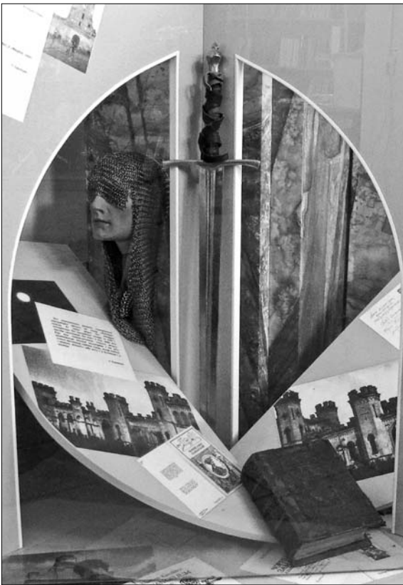
Подых гісторыі (фрагмент экспазіцыі Арышанскага музея У. Караткевіча).

Гады настаўніцтва былі плённымі і ў літаратурным плане. Хоць праца ў школе адымала час ад творчай дзейнасці. Ён поўны творчых пошукаў і пла-