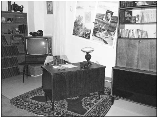
Рабочы стол У. Караткевіча.

рамана Уладзіміра Караткевіча «Каласы пад сярпом тваім» знайшлося месца і для апісання Оршы канца XIX стагоддзя. У адным інтэрв'ю пісьменнік казаў пра гэты раман так: «Пачынаўся ён з Дняпроўскіх легенд і паданняў, з паэтычнай і вельмі прыгожай прыроды ад Рагачова да Оршы». Узгадваюцца падзеі аршанскай гісторыі і ў рамане «Хрыстос прыязмліўся ў Гародні», у многіх нарысах і эсэ. А ў лірычных творах аб родных мясцінах так многа пяшчоты і замілання.