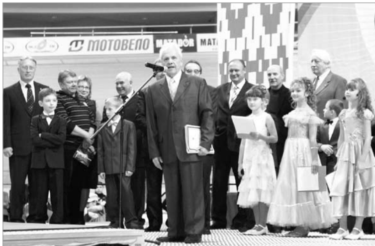
Падчас сустрэчы з сябрамі “Вясёлкі”.