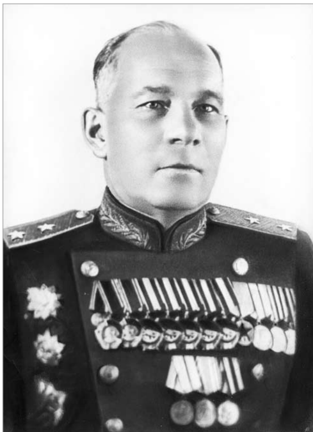
Генерал-лейтэнант А. Казанкін – камандуючы паветрана-дэсантнымі войскамі СССР.

канні штаба корпуса сабраліся амаль усе камандзіры і палітработнікі.