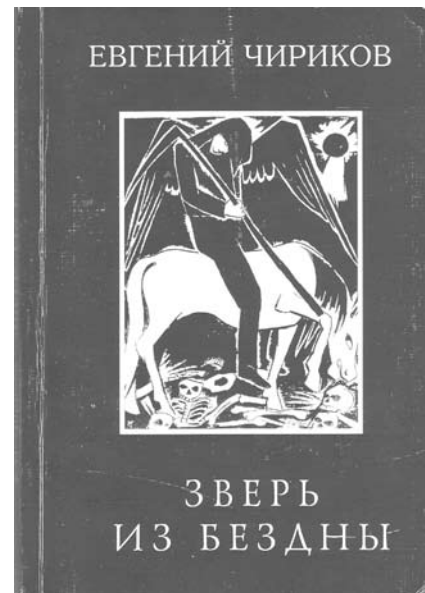
Вокладка рамана Яўгена Чырыкава, выдадзенага ў Мінску. 2000 г.

Цікавыя ўспаміны пра мінскія стасункі Лесі Украінкі і Сяргея Мяржынскага, таксама ролю ў іх Яўгена Чырыкава і яго сям’і напісала ў 1932 г. Вера Аляксандрава, дачка пісьменніка Данілы Мардоўцава. Прывядзем некалькі фрагментаў: “Калі мы, я і мой муж, пераехалі ў 1898 годзе з Саратава ў Мінск, то першае знаёмства, зробленае намі, было знаёмства з Чырыкавымі. Сам Чырыкаў аказаўся вясёлым, дабрадушным, сімпатычным чалавекам, а жонка яго – вельмі прыгожай, маладзенькай жанчынай. У іх мы сустрэліся з Сяргеем Канстанцінавічам Мяржынскім, саслужыўцам Яўгена Мікалаевіча Чырыкава. <...> З Чырыкавым ён быў у вельмі добрых сяброўскіх адносінах і быў іх пастаянным госцем, а калі пазнаёміўся з намі, то і ў нас стаў бываць вельмі часта”; “Пасля ад’езду Ларысы Пятроўны (сапраўднае імя, імя па бацьку Лесі Украінкі. – М. Т.) шмат у мяне было размоў з Чырыкавымі. Між іншым, яны сцвярджалі, што нягледзячы на ўзаемнае каханне Ларысы Пятроўны і Сяргей Канстанцінавіч вырашылі не браць шлюб, таму што абое пакутавалі ад туберкулёзу: Ларыса Пятроўна – ад коснага (таму яна і кульгала),