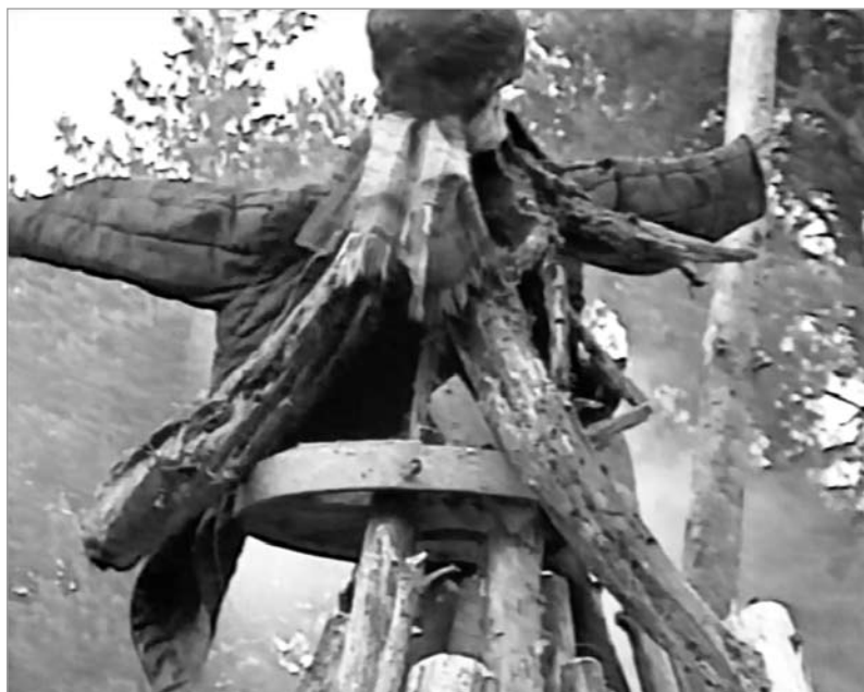
Спальванне купальскай лялькі-чучала. Полацкі раён. 1995 г.

Звычайна гэта можа быць чучала, падобнае на цела дарослага чалавека, ці лялька, што нагадвае спавітае немаўля. Лялькі першага тыпу падобныя на слуп ці крыж, яны шырока распаў-