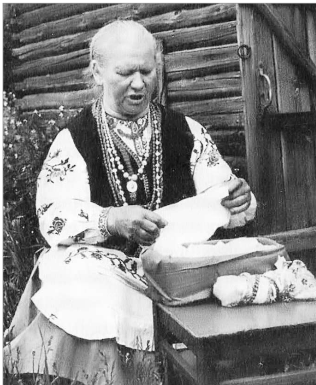
Жыхарка вёскі Барталамееўка Веткаўскага раёна рыхтуе ляльку для абраду “Пахаванне стралы”.

сюджаны ў Беларусі ў масленічным, русальным, купальскім абрадах. Напрыклад, для абраду “пахавання Дзеда” (“усім быў Дзед”), які існаваў на Віцебшчыне ў першы дзень Масленіцы, саламянае чучала рабілася так: “Адзежу яму – так як і чалавеку, і абум. Размер, як сапраўдны чалавек. Глазы наводзім, бараду з ільну. Абкруцім твар белым палатном і на ём наводзім глазы, нос, рот вулём. Дзеду рабілі маркоўку і вяроўкай цягалі, каб маркоўка ўстала. Накрывалі цюлем, як пакойніка” [3, с. 81]. Далей ладзілі парадыйнае пахаванне чучала, галасілі над ім, прыводзілі маскіраванага святара, пасля везлі ляльку за вёску, пры гэтым па дарозе мужчыны маглі схапіць Дзеда, кінуць яго на якую-небудзь жанчыну, паваліць яе ў снег разам з чучалам і крыкнуць: “Сідорка на Ганну ўзлез, шчас яе Мікола дасць яму поўху” [3, с. 92]. У канцы абраду ляльку закопвалі ў снезе ці палілі на вогнішчы, а ў хаце, дзе адбывалася “пахаванне”, ладзілі сумеснае частаванне з рытуальнай стравай – сырніцай. У апошні дзень Масленіцы рабілася падобнае “пахаванне Бабы”, для якога рабілі ўжо ляльку-бабу з вялікімі грудзямі, якую таксама хавалі, а потым ладзілі “памінкі”. У канструкцыі гэтых лялек выразна падкрэсліваліся ідэі плоднасці і эратызму, якія абыгрываюцца падчас абраду, а рытуальнае пахаванне лялек узмацняе сувязь з памерлымі продкамі.