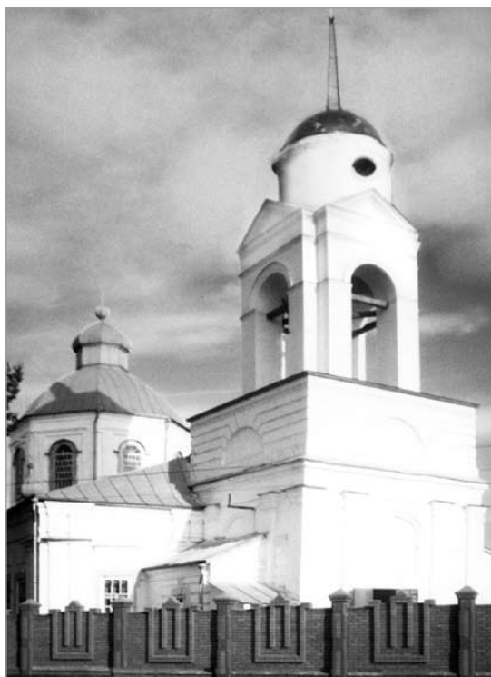
Троіцкі сабор у Буінску.

Калі пачалася рэвалюцыя, якая пасля перарасла ў грамадзянскую вайну, ён, як і мно-