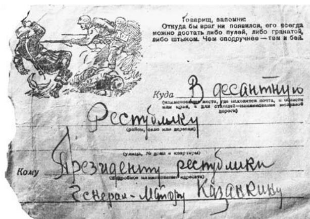
Фрагмент паштоўкі са словамі падтрымкі героям-дэсантнікам.

Дыярама, усталяваная ў 1973 г. у музеі паветрана-дэсантных войскаў у Разані, вяртае нас