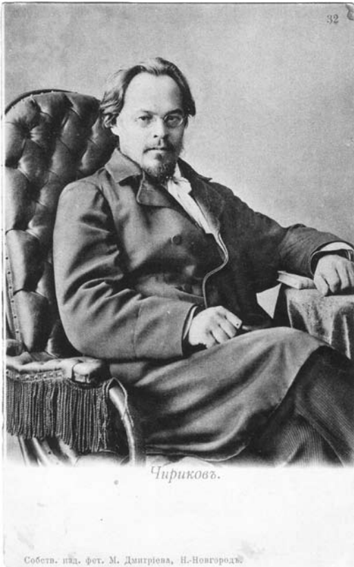
Яўген Чырыкаў. Партрэт-паштоўка пачатку ХХ ст. З фондаў Літаратурнага музея Максіма Багдановіча.

“Мир божий”, “Северный вестник”, “Новое слово”, “Вестник Европы” і інш.