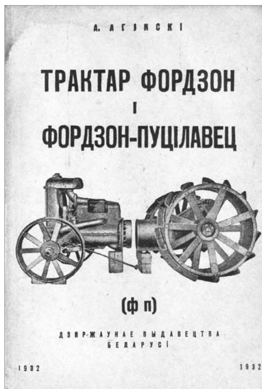
Вокладка навукова-тэхнічнага выдання 1932 г.