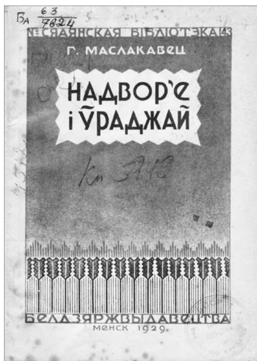
Вокладка выдання 1929 г.

РЭХА МІНУЛАГА, ПОСТУП СУЧАСНАСЦІ НА ВЫСТАВЕ Ё БЕЛАРУСКІМ ДЗЯРЖАЎНЫМ ТЭХНАЛАГІЧНЫМ УНІВЕРСІТЭЦЕ