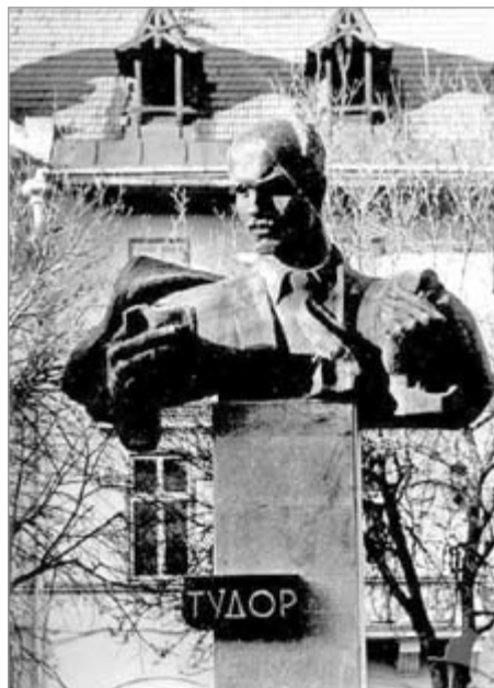
Помнік Сцяпану Тудору ў Львове.

Праграма і задачы арганізацыі былі сфармуляваны на першым з’ездзе ў 1930 г.: асвятленне бядотнага становішча працоўных, рэвалюцый-