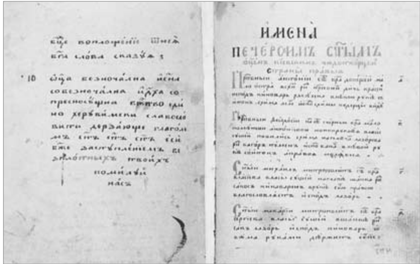
“Подлинник иконописный”. Рукапіс-канвалют канца XVII – пачатку XIX ст. Захоўваецца ў музеі Гомельскага палацава-паркавага ансамбля.

Высокія маральныя патрабаванні да майстра-іканапісца вызначаюць як высокую духоўнасць яго працы, так і яго статус. “Подобает убо изографом рекше иконописцем, чистительным быти; житием духовным жити и благими нравами, смиренном же и кротостию украшатися, и о всем благоволити; а не сквернословцем; ни кощунником, ни блудником, ни пияницем. Ни клеветником; ни иным таковым, ниже послужующе обычаем скверным...” Далей тлумачыцца, што таму, хто пайшоў на такую святую справу, усё названае не можа быць даравана. «А калі хто і дасягнуў дасканаласці ў выяве святых ікон, але жыве