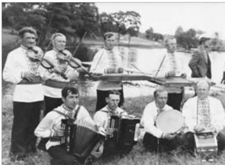
Самадзейны ансамбль “Каласы”.

Мэта артыкула – фіксацыя абласцей уплыву культурнай прасторы як сістэмы дэтэрмінантаў, што абумоўліваюць своеасаблівасць развіцця беларускага скрыпічнага выканальніцкага мастацтва вуснай традыцыі гродзенскага рэгіёна.