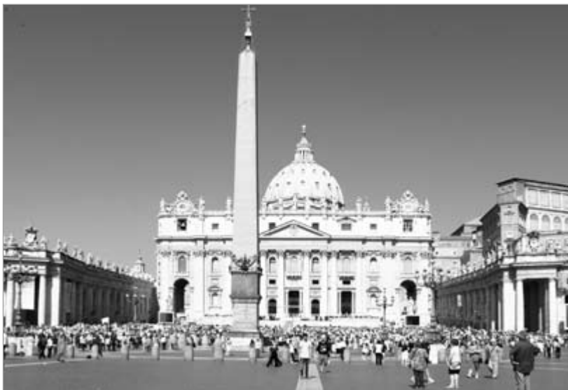
Абеліск на плошчы Святога Пятра ў Рыме.

Вядомы расійскі культуролог і архітэктурознаўца Г. Рэўзін разглядае семантыку абеліска толькі ў новаеўрапейскай архітэктуры, пачынаючы з Рэнэсансу. Пры гэтым ён адразу адмяжоўваецца ад архетыпаў і сацыяльна-гістарычнай эвалюцыі формы абеліска, што ў выніку зводзіць яго значэнне да двух аспектаў: а) надмагілля – сімвала смерці; б) горадабудаўнічага акцэнта ў семіятычным сэнсе “я ёсць”. Характэрна, аднак, што ў змястоўных разважаннях гэтага аўтара ніводнага разу не сустракаюцца словы вечнасць, памяць, хрысціянства . Пры гэтым смерць разглядаецца ім толькі як распад арганічнай матэрыі ці, у лепшым выпадку, як сюжэт антычнага міфа, пераход нябожчыка ў царства Аіда. Ён апрыйёры адмаўляе таксама найстаражытнейшую фалічную семантыку абеліска, характэрную для фрэйдызму і шэрагу еўрапейскіх эзатэрычных канцэпцый. У выніку даследчык прыходзіць да спрэчнай высновы, што абеліск – “знак з падкрэсленай адсутнасцю сэнсу” [6].