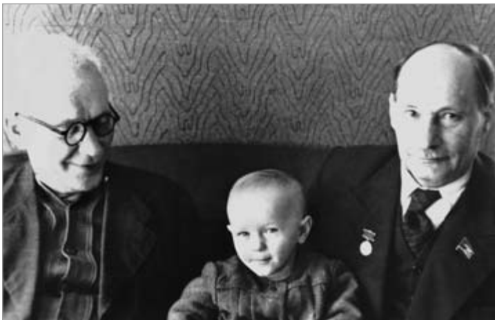
Янка Маўр і Якуб Колас з агульным унукам Сяргеям. 1950-я гг.

прапанаваць знайсці і дапоўніць навінамі або каментарыямі створаную энтузіястамі асабістую старонку пісьменніка на фэйсбуку па спасылцы http://ru-ru.facebook.com/pages/Янка-Маўр-Янка-Мавр/325407627564431 альбо арганізаваць рэпост навінаў з групы “Клуб аматараў фантастыкі і фэн-тэзі” пад тэгам “Янка Маўр” (адрас http://vk.com/pages?oid=-15870326&pr=%D0%AF%D0%BD%D0%BA%D0%B0_%D0%9C%D0%B0%D1%9E%D1%80 ) на “сцяну” карыстальніка “УКантакце”.