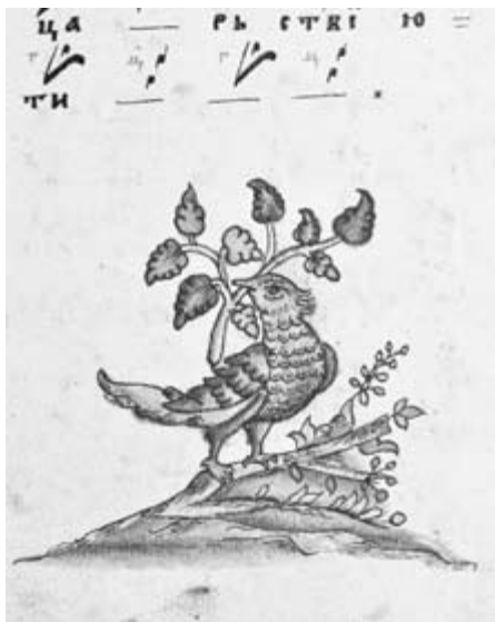
Адзін з меркаваных сімвалаў “цветушчай Ветки” – сокал з галінкай у дзьобе. Рукапіс XVIII ст.

куша збор захоўваўся ў доме злотнікаў (“златокузнецов”) дынастыі Свяшчэннікавых.