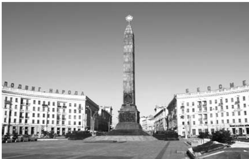
Манумент Перамогі ў Мінску.

Дасканаласць абеліска як амаль ідэальнай цэнтрычнай архітэктурна-прасторавай формы была ацэнена ў Еўропе ў Новы час. Свецкі паводле сваёй сутнасці італьянскі Рэнэсанс не зважаў на пантэістычны характар абеліска як сакральнага знака. Адраджаючы абеліск як