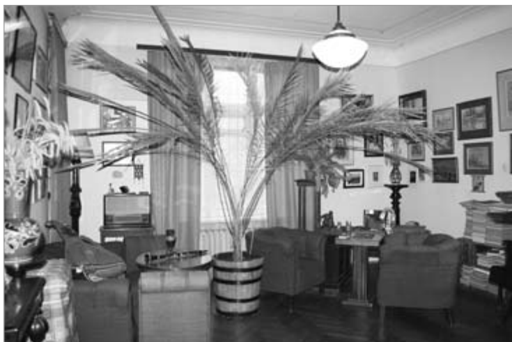
Працоўны кабінет Паўла Тычыны.

трабавальнасць паэта да асабістага камфорту і інш.