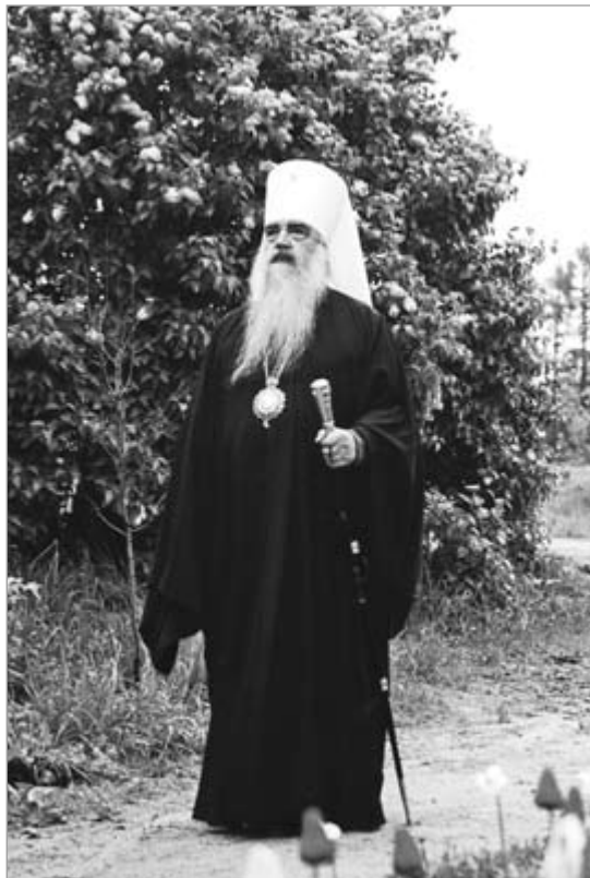
Высокапраасвяшчэннейшы Філарэт, Мітрапаліт Мінскі і Слуцкі, Патрыяршы Экзарх усяе Беларусі.

Прытрымліваючыся “даўніны свецкай і старых кніг”, Аляксандр Іванавіч вёў вельмі размеранае і простае жыццё, што вылучалася асаблівай ашчаднасцю. Пачаўшы з малога, разумны і дзелавіты Вахrameeў паступова стаў даволі заможным гаспадаром. З 1863 г. – кіраўнік буйной прамысловай мануфактуры, якая спецы-