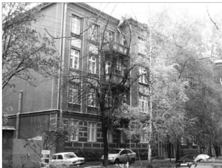
Будынак, у якім размяшчаецца Літаратурна-мемарыяльны музей-кватэра Паўла Тычыны.

У музеі паяднаны розныя планы: выкшталцонасць і аскетычнасць, духоўнае багацце і сціпласць абстаноўкі, дзяржаўная веліч і непа-