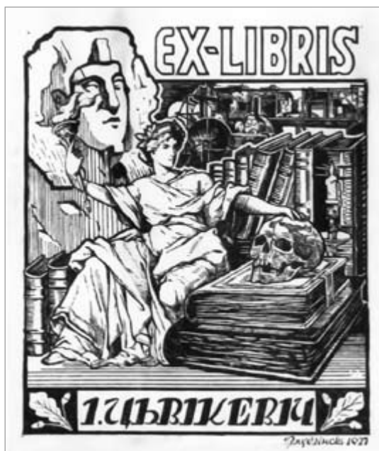
Генадзь Змудзінскі. Экслібрыс І. Цвікевіча. 1927 г.

Людміла НАЛІВАЙКА, кандыдат мастацтвазнаўства, Яўген ШУНЕЙКА, кандыдат мастацтвазнаўства.