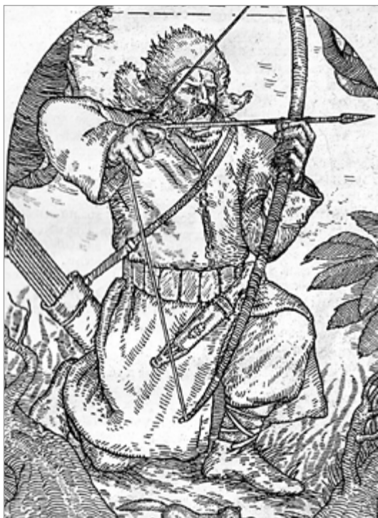
Ваяр часоў Вялікага Княства Літоўскага.

мяшчаліся з прызнаннем і ўзвялічваннем ролі памерлага. У кропцы напалу дзеяння па вертыкалі – свет зямны і свет трансцэндэнтны (мяжа жыцця і смерці), а па гарызанталі – свет рэальны і свет ігравы (мяжа сапраўднага пахавання і спектакля з гэтай нагоды). Неабходнымі выразнымі сродкамі былі хрысціянская і шляхецкая сімволіка і эмблематыка як адлюстраванне свету вобразаў і свету існых рэчаў [6, с. 3].