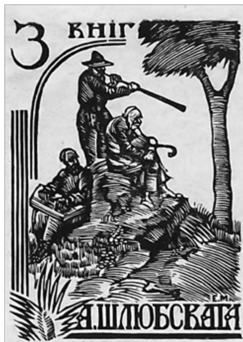
Яўхім Мінін. Экслібрыс А. Шлюбскага.

Чым больш мы паглыбляемся ў асэнсаванне каштоўнасці экслібрысаў 1920-х гг., тым больш знаходзім стваральных ідэй для развіцця сучаснай кніжнай культуры. Вялікую цікавасць да беларускага экслібрыса праяўлялі Ленінградскае і Маскоўскае таварыствы кніжнага знака, вывучалі і друкавалі даследаванні, прысвечаныя яму, на старонках сваіх выданняў. У 1925 – 1930 гг. беларускі экслібрыс экспанавалася на ўсебеларускіх, усесаюзных і міжнародных выстаўках кніжнага знака ў Расіі (Масква, Ленінград), Украіне (Львоў), Германіі (Лейпцыг), ЗША (Лос-Анджэлес). Разам з тым экслібрыс 1920-х гг. моцна пацярпеў ад рэпрэсій. У спісы ворагаў народа надоўга трапілі