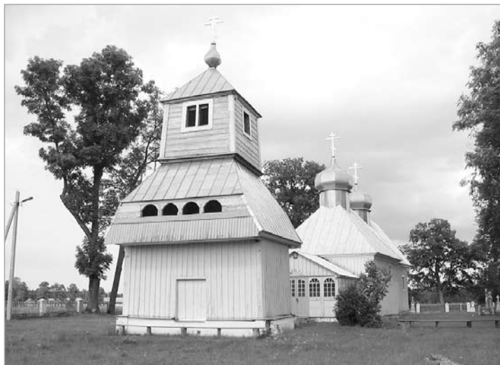
Званіца Міхайлаўскай царквы ў вёсцы Чэрск Брэсцкага раёна.

Стылявой і канструкцыйнай характарыстыкай традыцыйных званіц з’яўляецца наяўнасць