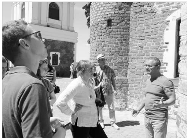
Падчас заняткаў у “Нясвіжскай акадэміі”.

У 1992 г., перад святкаваннем 200-годдзя з дня нараджэння А. Міцкевіча, пачалася праца па адраджэнні сядзібы Міцкевічаў у вёсцы Завоссе Баранавіцкага раёна, сядзібна-паркавага комплексу “Туганавічы” ў вёсцы Карчова Баранавіцкага раёна. З мэтай рэстаўрацыі, адра-