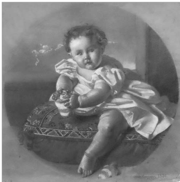
Арэст Кіпрэнскі (?). Партрэт графа Пятра Вітгенштэйна ў маленстве. 1831 г. Збор музея «Замкавы комплекс "Мір"».

У 1828 – 1836 гг. ён жыў у Італіі: з восені 1828 г. да сярэдзіны красавіка 1832 г. [3, с. 303] знаходзіўся ў Неапалі, часам выязджаючы ў Рым