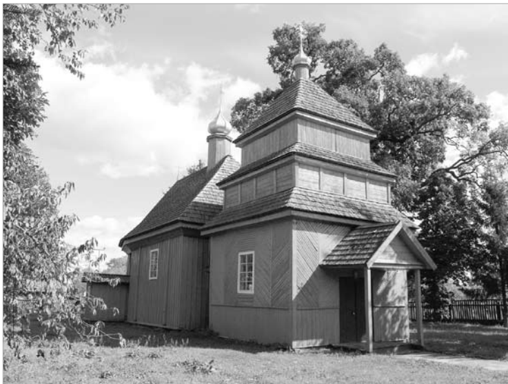
Званіца Міхайлаўскай царквы ў вёсцы Рамель Столінскага раёна.

жары і розныя іншыя перыпетыі лёсу, ацалела яшчэ даволі шмат. Пытанні генезісу і эвалюцыі драўляных званіц закраналіся шматлікімі даследчыкамі храмабудаўніцтва ўсходнеславянскіх народаў канца XIX – пачатку XX ст. Іх асабліва прыцягвалі непараўнальныя па сваёй прыгажосці храмавыя ансамблі са званіцамі Галіцыі, Валыні, Падолля, Лемкаўшчыны, якія кожны з даследчыкаў імкнуўся далучыць да культурна-гістарычнай спадчыны свайго народа. Адпаведная спадчына Беларусі, тагачаснага “Северо-Западного края” Расійскай імперыі, у той час нікога не цікавіла. Навуковая цікавасць да іх праявілася толькі з пачаткам станаўлення айчыннага мастацтвазнаўства (У. Краснянскі, В. Ластоўскі, У. Чантурыя, Т. Хадыка-Габрусь, Ю. Якімовіч, С. Сергачоў, А. Лакотка). Аднак генезіс, а таксама архітэктурныя формы і мастацкі вобраз драўляных званіц даследчыкі разглядалі і сістэматызавалі па-рознаму. М. Красоўскі, які вывучаў храмавыя званіцы Рускай Поўначы і “Малороссии”, а таксама “вобласці Войска Данскога”, класіфікаваў іх па колькасці ярусаў [1]. У. Чантурыя, які першым зрабіў спробу вызначыць адметнасці беларускіх званіц, падзяляў іх па тыпе канструкцыі [2]. Аднак названыя падыходы не мелі храналагічнай асновы і не выяўлялі эвалюцыі архітэктурна-мастацкіх форм.