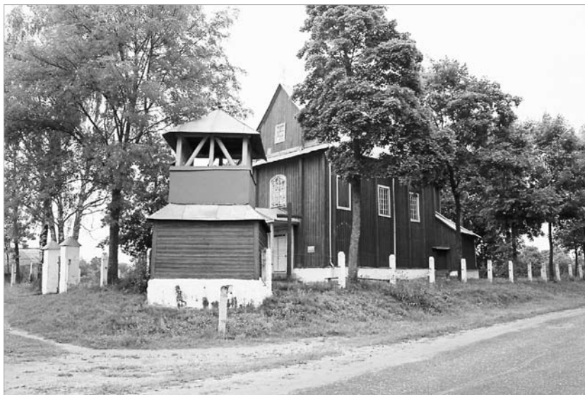
Званіца Троіцкай царквы ў вёсцы Лявонпаль Міёрскага раёна.

Адзін з самых важных мастацкіх прынцыпаў барока – стварэнне разгорнутага архітэктурна-прасторавога храмавага ансамбля. Асноўным сродкам узбагачэння і развіцця архітэктурнага ансамбля часоў барока з’яўляецца асобнае ад касцёла размяшчэнне званіцы нават пры наяўнасці высокіх вежаў на галоўным фасадзе. Характэрна, што драўляныя званіцы ставіліся побач як з драўлянымі, так і з мураванымі святынямі. Храм заўсёды займаў дамінантнае становішча ў планіровачнай структуры населенага пункта – каля гандлёвай плошчы горада, мястэчка ці сяла. Яго тэрыторыя з невялікімі могілкамі (цмянтар, цвінтар) вылучалася драўлянай ці мураванай агароджай з брамай, якая часам спалучалася са званіцай. Вось фрагменты інвентароў старажытных помнікаў XVII – XVIII стст.: “цмянтар бяровеннямі вакол агароджаны, на ім званіца аб трох кандыгнацях” (касцёл Божа-