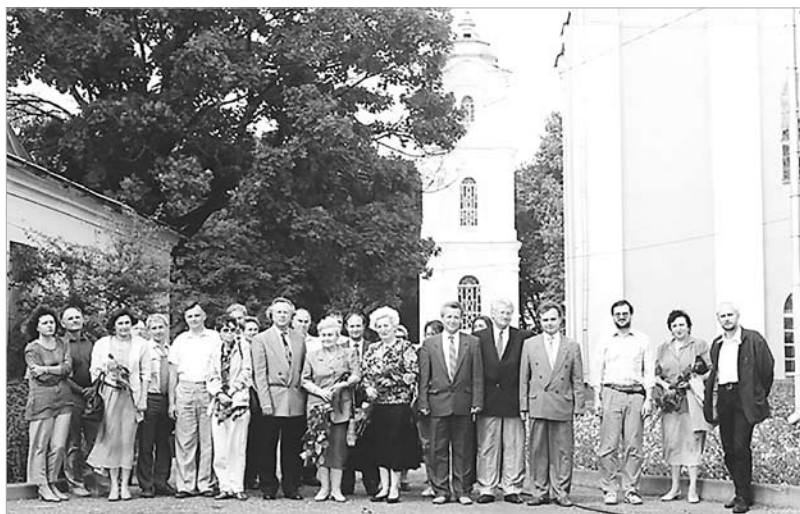
Сустрэча прадстаўнікоў беларуска-польскага савета “Нясвіжскай акадэміі”. Нясвіж. 1995 г.

“Нясвіжская акадэмія” стваралася на пачатку 1990-х гг. – у перыяд, калі ў Беларусі толькі фарміравалася рэстаўрацыйная і кансервацыйная школа ў выглядзе пэўных інстытуцый. У 1985 г. створана Беларускае спецыялізаванае навукова-рэстаўрацыйнае вытворчае аб’яднанне “Белрэстаўрацыя” ў складзе міжабласных навукова-рэс-