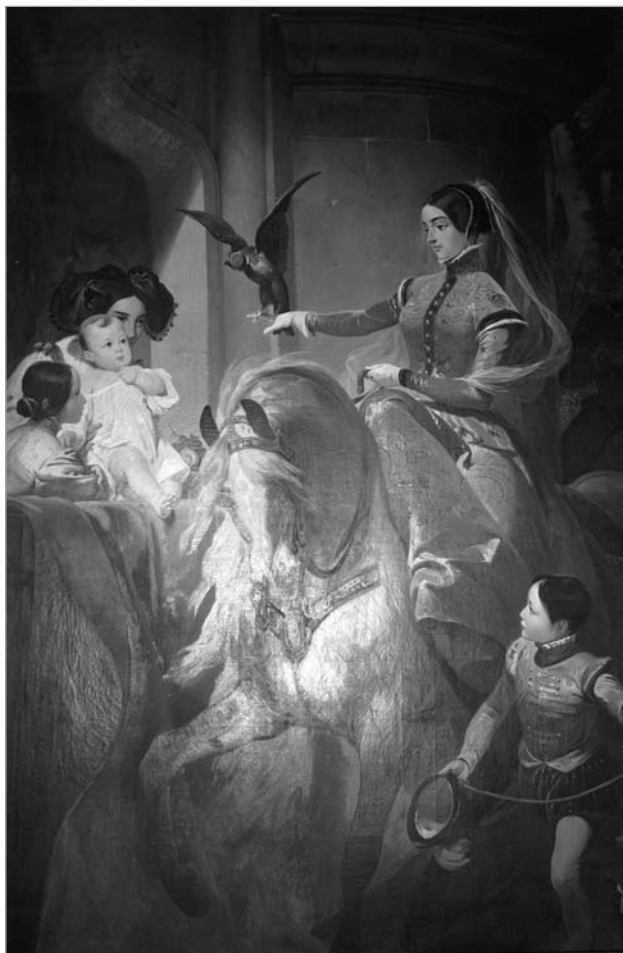
Эміль Жан Арас Вернэ. Княгіня Леаніла Сайн-Вітгенштэйн-Сайн на кані. 1837 г.

маленькая дзяўчынка сядзіць на руках прыгожай нянькі ў рускім какашніку і сарафане. Гэтыя партрэты можна лічыць правобразамі ўсіх астатніх прац, на якіх паказаны дзеці Вітгенштэйнаў.