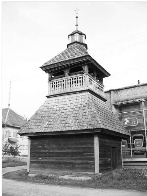
Званіца Петрапаўлаўскай царквы ў вёсцы Шарашова Пружанскага раёна.

вы ў вёсцы Моладава Іванаўскага раёна, прыбудаваў да храма ў XIX ст., знаходзіцца званіца, адліты ў Коўне ў 1583 г. на сродкі Сымона Войны, кашталяна мсціслаўскага, уладальніка моладаўскага маёнтка. Званіца аздоблена гербам роду Войнаў з выявай трох труб, трох рэк і пяціканцовай зоркі, які суправаджаюць шэсць надпісаў на старабеларускай мове, чаканеных лацінкай. Тэксты распавядаюць пра жыццё бацькі ахвяравальніка і гісторыю стварэння звона. Гэты каштоўны артэфакт выяўлены, вывучаны і выратаваны экспедыцыяй сектара “Збору помнікаў гісторыі і культуры Беларусі” пад кіраўніцтвам Э. Вецер і Ю. Хадзкі ў 1970 г. [10]. Доўгі час ён знаходзіўся ў Музеі старажытнабеларускай культуры НАН Беларусі, пасля адраджэння царквы вернуты вернікам.