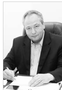
Сяргей ВАЖНИК, дырэктар Нацыянальнага інстытута адукацыі.

Роднаслоўаўцы – гэта заўсёды найлепшыя прафесіяналы, апантанія і няўрымслівыя рупліўцы, якія сваёй нястомнай працай спрыяюць павышэнню прафесійнага майстэрства беларускіх настаўнікаў, гадаванню інтэлектуальнай эліты нашай краіны, выхаванню сапраўдных патрыётаў і грамадзян. Жадаем калектыву рэдакцыі развіваць і памнажаць слаўныя традыцыі часопіса! Няхай будзе бяздоннай крыніца цікавых ідэй і творчай энергіі! Прафесійнага даўгалецця і здзейсненых мар, плённай працы і ўдзячнай аўдыторыі!