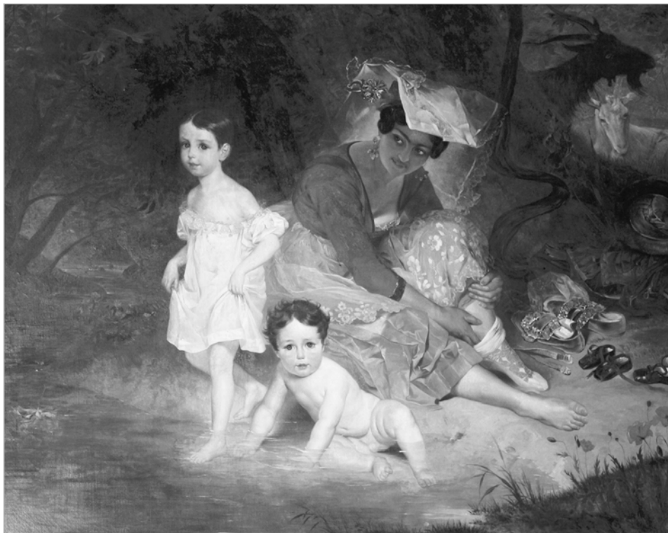
Карл Брулоў. Дзеці Вітгенштэйна з нянькай-італьянкай, якія купаюцца ў лясным вадаёме. 1832 г. Прыватны збор.

Сапраўднасць малюнка першапачаткова не выклікала ў нас сумненняў. Гісторыя яго бытавання вельмі простая: твор перадаваўся ў спадчыну. У 2016 г. музей «Замкавы комплекс «Мір»» дамовіўся з уладальнікам пра яго набыццё. З мэтай ацэнкі музей замовіў незалежную экспертызу малюнка ў Лабараторыі тэхналагічнай экспертызы «Арткансалтынг» у Маскве [11, с. 1 – 8]. Высветлілася, што папера такой якасці і спосабу тэхналагічнай вытворчасці пачала выкарыстоўвацца толькі ў 1860-я гг. З улікам таго, што А. Кіпрэнскі памёр у Італіі ў 1836 г., такі вынік экспертызы можа сведчыць пра тое, што перад намі копія. Музей набыў гэты твор, і цяпер магчыма яго больш глыбокае даследаванне.