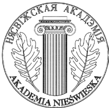
Эмблема “Нясвіжскай акадэміі”.

зацыі іх праграм, акрамя грамадскіх арганізацый, выступаюць установы вышэйшай адукацыі і навуковыя цэнтры: Летняя школа Тартускага ўніверсітэта па міжнародным праве (Эстонія), Летняя школа Аб’яднанага інстытута ядзерных даследаванняў (Расійская Федэрацыя), Летняя школа ў Інстытуце Вейцмана (Ізраіль) і інш.