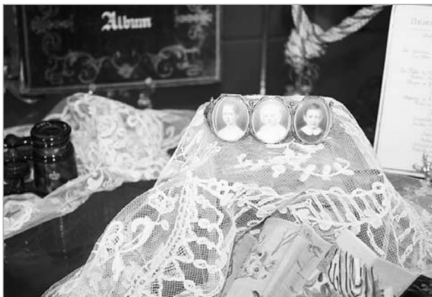
Бранзалет княгіні Леанілы Вітгенштэйн з партрэтамі дзяцей. Збор князя А. Вітгенштэйна ў Сайнскім палацы.

та – на бранзалете, які належаў Леаніле Іванаўне Вітгенштэйн. Бранзалет складаецца з трох авальных мініячур з выявамі твараў Марыі, Пятра і Фёдара. Нам падаецца, што адсутнасць іншых дзяцей сведчыць пра тое, што бранзалет быў створаны паміж 1836 і 1839 гг., да нараджэння наступнага па чарзе дзіцяці – Антуанеты. Акрамя таго, што гэты партрэт можна лічыць вельмі рэдкім творам ювелірнага мастацтва, ён дазваляе зрабіць пэўныя высновы пра адносінны, якія склаліся паміж мачахай і дзецьмі Льва Пятровіча ад першага шлюбу. Відавочна, што яна клапацілася пра іх, успрымала нароўні са сваімі дзецьмі, прынамсі ў першыя гады замужжа.