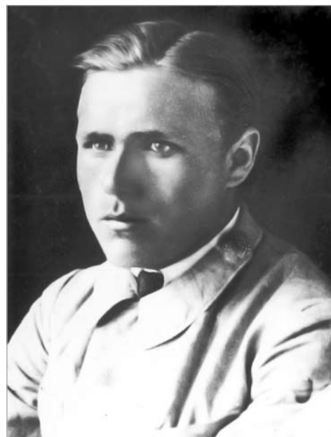
Гаўрыла Гарэцкі. Масква. 1923 г.

Вобразная сістэма верша цалкам засноўваецца на архетыпах – жыта, нівы, коласа, зерня, арагата. Такая насычанасць сэнсава значнымі