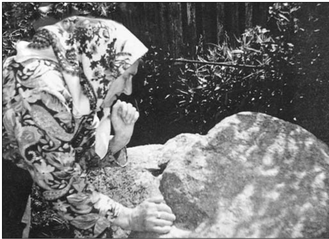
Камень, на якім адпачываў Бог, в. Маяк, Слуцкі р-н.

порчы на людзей. У беларускіх міфалагічных расповедах вельмі папулярны матывы слядоў, пакінутых продкамі ў памінальныя дні на папярэдне рассыпаным попеле або жвіры. Дарэчы, у старажытнай традыцыі нашага народа раней існаваў звычай рабіць памінальныя кладкі з выразанымі на іх слядкамі нябожчыка і класці іх у балоцістыя мясціны, якія, паводле дахрысціянскіх вераванняў, былі ўваходам у іншасвет. Лічылася, што душа пасля смерці доўга блукае па свеце, пакуль не знойдзе туды дарогу. Кладкі ж павінны былі дапамагчы ёй у такой сітуацыі. А загадкавыя валуны са слядкамі, што раскіданы па Беларусі, звычайна месцяцца ў нізінных і балоцістых мясцінах, побач з крыніцай ці ручаём. Ці не яны былі сведкамі далёкіх і таямнічых памінальных абрадаў нашых продкаў?