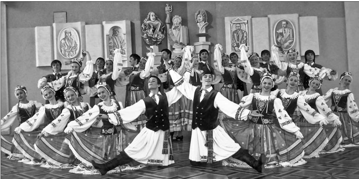
Гонар каледжа — ансамбль «Гарадзенскія карункі».