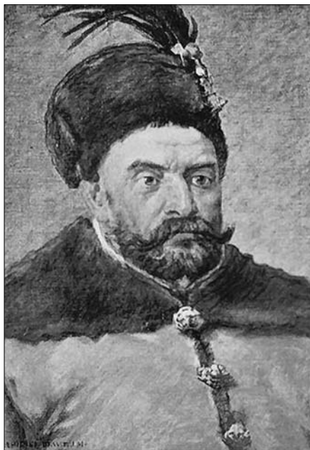
Вялікі князь літоўскі і кароль польскі Стэфан Баторый. Партрэт работы Яна Матэйкі.

Стэфан Баторый — кароль польскі і вялікі князь літоўскі, рускі і жамойцкі з'яўляецца адной з найбольш вядомых і значных асоб у гісторыі Беларусі XVI стагоддзя. Сапраўднае імя і прозвішча Стэфана Баторыя — Іштван Батары або, як правільна будзе па-венгерску, Батары Іштван, бо ў мадзьяраў спачатку пішацца прозвішча, а потым імя. Гэта быў чалавек незвычайнага лёсу, які панавалі ў трох краінах і паўсюль зваўся па-рознаму. На Беларусі ж яго называлі Сцяпан Батура. Каралём ён быў толькі адзінаццаць гадоў. Але за час свайго панавання ў Польшчы і Беларуска-Літоўскай дзяржаве, аб'яднаных тады ў канфедэратыўную Рэч Паспалітую, ён праславіўся як палкаводзец, дыпламат, рэфарматар і мецэнат. З найбольш важных яго рэформ трэба адзначыць утварэнне галоўных судоў — Трыбунала Кароннага ў Польшчы і Галоўнага Трыбунала Літоўскага ў Беларуска-Літоўскай дзяржаве, склад якіх выбіраўся з шляхецкіх дэпутатаў, а не прызначаўся якім-небудзь органам улады. Вялікім крокам у нашым краі было ўтварэнне Баторыем 1 красавіка 1579 г. Віленскай акадэміі — вышэйшай навучальнай установы, роўнай у правах з Ягелонскім універсітэтам у Кракаве. У гэтай акадэміі вучыліся сотні студэнтаў з Беларусі, Жамойці і іншых нашых земляў на працягу больш чым 250 гадоў.