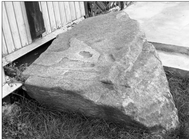
Камень са следам святога Антонія каля касцёла, в. Струбніца, Мастоўскі р-н.

У вёсцы Камайск Докшыцкага раёна сляпому жабраку быццам бы некалі з'явілася Прасвятая Багародзіца, якая стаяла на мясцовым камені. Яна паклікала старога і загадала яму ісці да ўладальніка гэтай мясцовасці, каб патрабаваць ад таго пабудовы царквы на месцы Яе з'яўлення. Жабрак так і зрабіў, пасля чаго стаў відушчым. Над каменем узвялі храм у гонар Багародзіцы. У вёсцы Пятровічы Смалявіцкага раёна некалі шанавалі авальны камень даўжынёй 70 см і шырынёй каля паўметра. Па распадах вяскоўцаў, на камені выразна быў бачны адбітак правай нагі Божай Маці і след ад Яе кічка. Па легендзе, калі Багародзіца праходзіла па беларускай зямлі і ішла праз Ляды і Пятровічы, Яна спынялася адпачыць ў гэтых месцах. І паўсюль, дзе ступала нага Божай Маці, пачыналі біць крынічкі, а на камянях адбіліся сляды Яе ног. Доўгі час каля каменя ў Пятровічах была добраўладкаваная крыніца, вада якой лічылася лекавай. Але пасля правядзення меліярацыйных работ яе засыпалі, а камень прыціснулі бетоннай плітой.