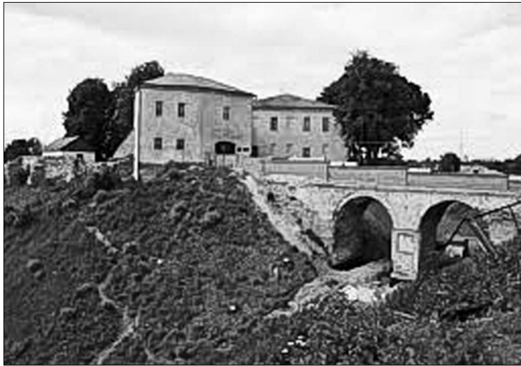
Сучасны выгляд Старога замка ў Гродне.

З 7 па 12 снежня гэта было ўжо паляванне на смерць.