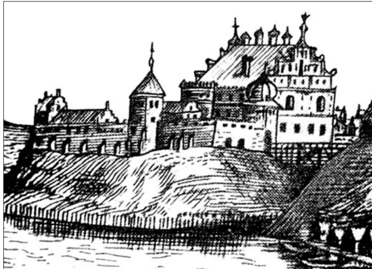
Каралеўскі замак у Гродне часоў Баторыя. Гравюра Томаша Макоўскага, 1600 г.

Ці выклікана смерць натуральнымі прычынамі, ці гэта было забойства — адно з пытанняў нашай гісторыі. Вось ўжо пятае стагоддзе трымаецца ўпартае падазрэнне, што кароль быў атручаны. Ён памёр без споведзі і прычашчэння, бо не адчуваў сябе