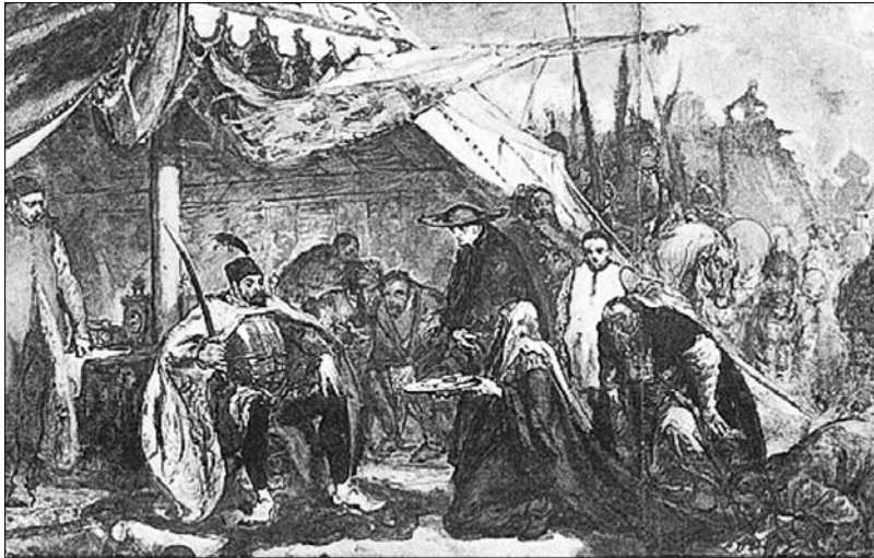
Стэфан Баторый пад Псковам. Малюнак Яна Матэйкі.

магчымасць Рэчы Паспалітай праводзіць сваю ўсходнюю палітыку. Перамогі войска, якім камандаваў Стэфан Баторый, уравалі Вялікае Княства Літоўскае ад спусташэння і зруйнавання, ад жудаснай акупацыі і ўнутранай палітыкі Івана Жахлівага — а прычынны са знішчэннем як баяр, так і іншых груп насельніцтва, уключаючы сялян. Для беларускай шляхты перамога над Масковіяй азначала не толькі захаванне жыцця і маёмасці, але і мясцовага самакіравання, заканадаўчага прадстаўніцтва, Статута Вялікага Княства Літоўскага 1566 г., асабістых правоў з правам асабістай недатыкальнасці. Весткі пра караля-ваю, выдатнага стратэга, рэфарматара войска пашыралі людзі пяра, канцэлярысты і вайскоўцы.