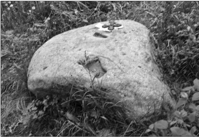
Культавы камень на вясковых могільках у в. Сянежычы, Навагрудскі р-н.