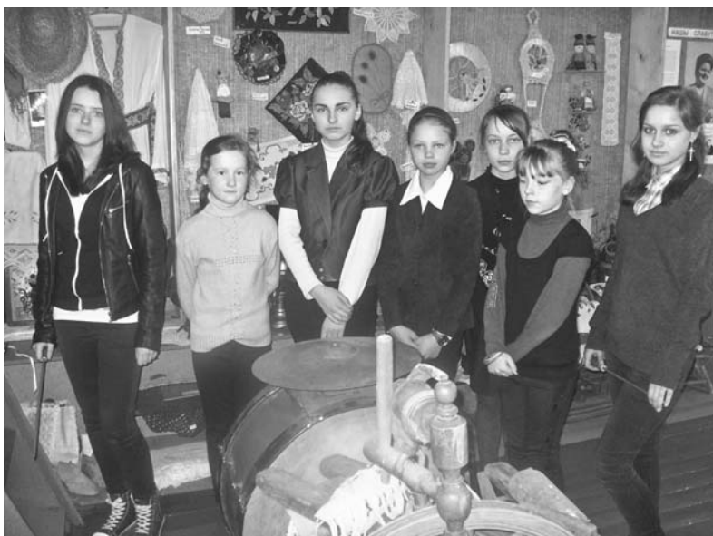
Члены гуртка «Музейзнаўства» ў сваім музеі.

ка — першыя ўрокі майстэрства таксама набыла ў нашай вёсцы. Жыццё і дзейнасць гэтых асоб з’яўляюцца прыкладам для нас, маладога пакалення.