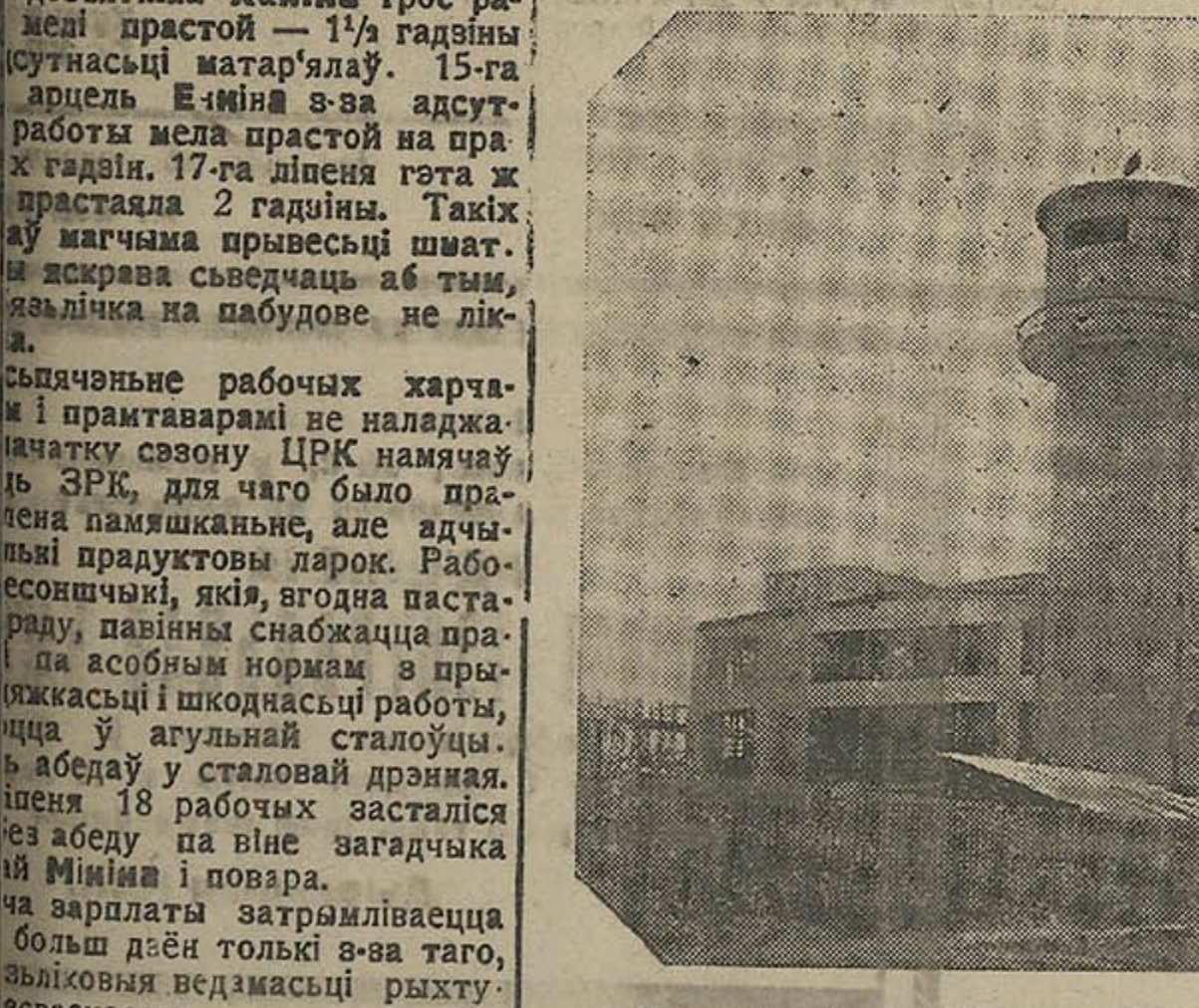
На здымку: Галоўны корпус новай панчошнай фабрыкі.

Камсамол Віцебску абавязваўся да 17 га МЮДУ пусьціць новую панчошную фабрыку—адзін з 518. На будоўлі сіламі камсалоўскіх ка- лектыву і ячэк арганізацыя шэраг суботнікаў. Новому волату вьці-