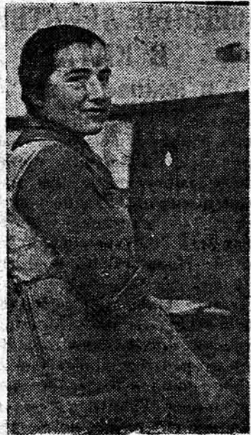
На фотаздымку тав. Праксэ А. — ледзяная кляшчыца на дзяржаўным фабрычным заводзе ў г. Беластоку. (Фота Сапір).

При городском комитете физкультуры работает боксерская секция, которую посещает 17 человек. Сейчас боксеры энергично готовятся к спортивной встрече с боксерами Белостока.