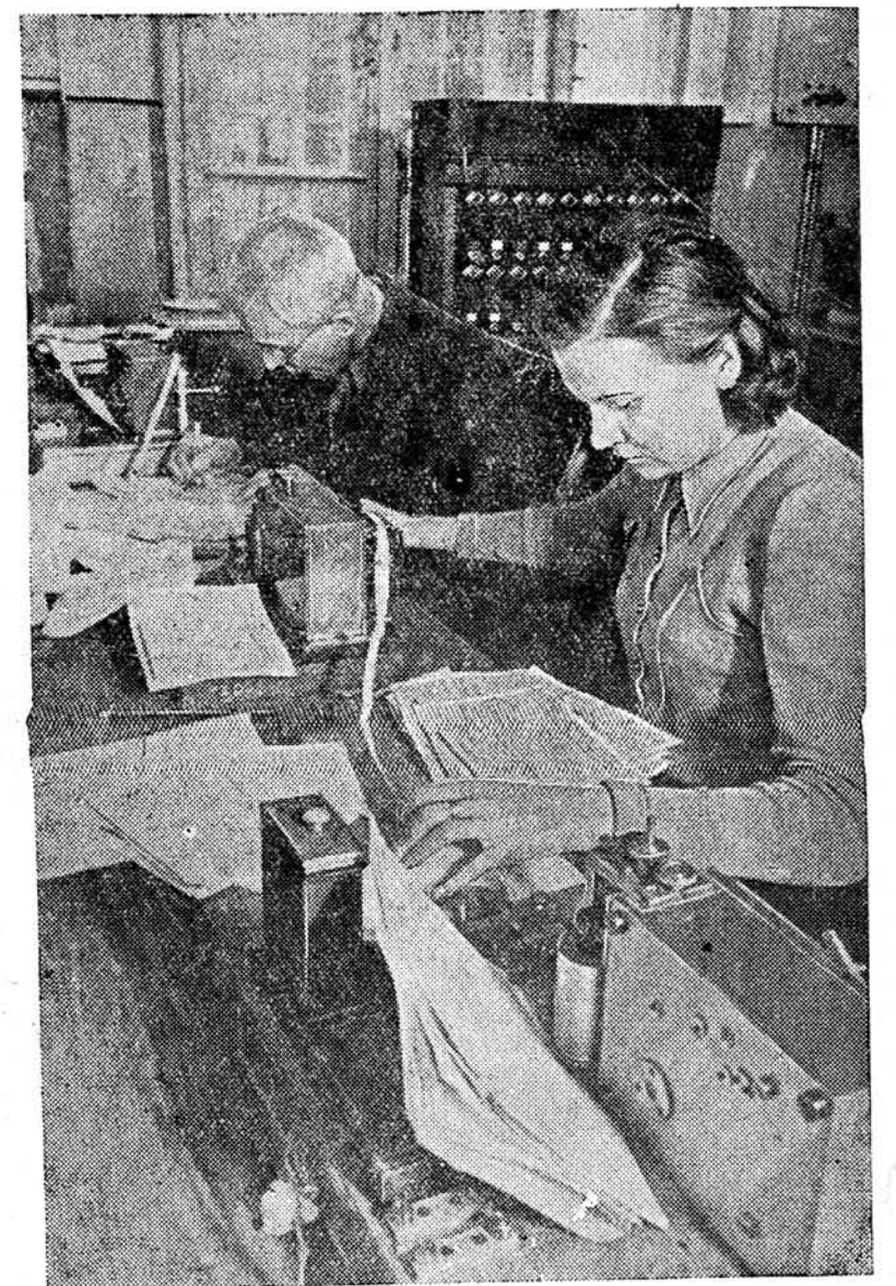
На снимке: прием телеграмм на центральном телеграфе г. Белостока.