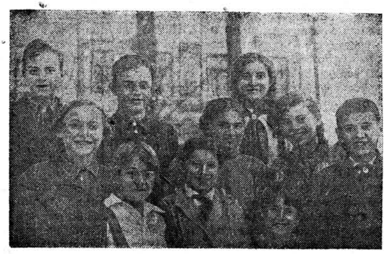
На здымку: Група дзяцей першай оускай савецкай школы ў г. Беластоку.