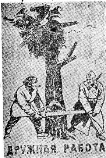
«Дружная работа» — репродукция с плаката, посвященного событиям в Финляндии. Работа худ. В. Говоркова.