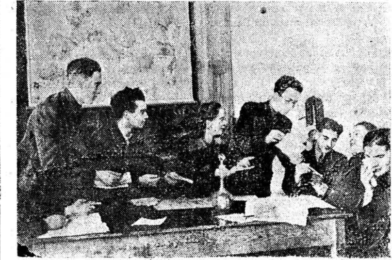
На здымку: рэпетыцыя п'есы „Матура“ у выкананні вучняў 42 школы г. Беларуска.

ларускага народа ў адзіную Беларуска дзяржаву. Пры кіностудыі створана спецыяльная рэдакцыя для збора гістарычных матэрыялаў і дакументаў, для правядзення сустрэч і гутарак з удзельнікамі вялікага вызваленчага пахода. (БЕЛАТА).