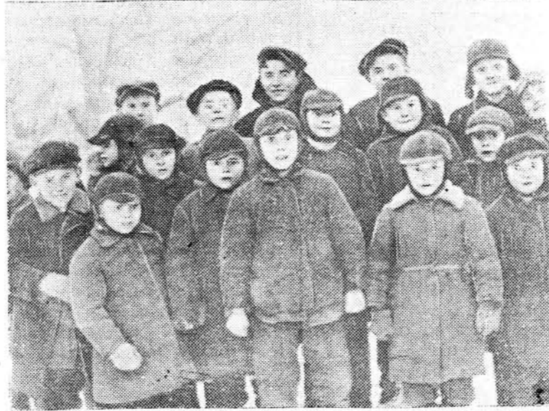
У вёсцы Тыльвіца, Беластоцкага раёна пры панаванні польскіх улад у школе займалася 100 дзяцей, а зараз у гэтай-жа школе навучаецца 300 дзяцей. На здымку: група вучняў, якая ўпершыню прыйшла ў школу.