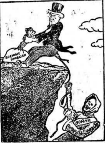
АМЕРИКАНСКАЯ РЕПКА. Дедка за репку, бабка за дедку... Рис. Ц. Лисевича.

Отмена запрета на вывоз оружия только удлинит сроки войны и втянет в войну Соединенные Штаты Америки. (Из газет).