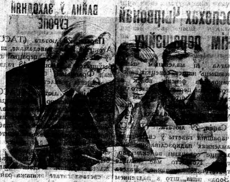
Арганізаванае сустрэць выбарчых камісій у выбарчым участку № 351-й Чырвонаармейскай акругі.

У гэтым пераходзе перадавай пачаўся пераход ад агітатарскай працы да працы агітатарскай камісіі. Гэты пераход пачаўся ў выбарчым участку № 351-й Чырвонаармейскай акругі на выбарах да Цэнтральнага Савета БССР. Тут жа і пачаўся пераход ад агітатарскай працы да працы агітатарскай камісіі.