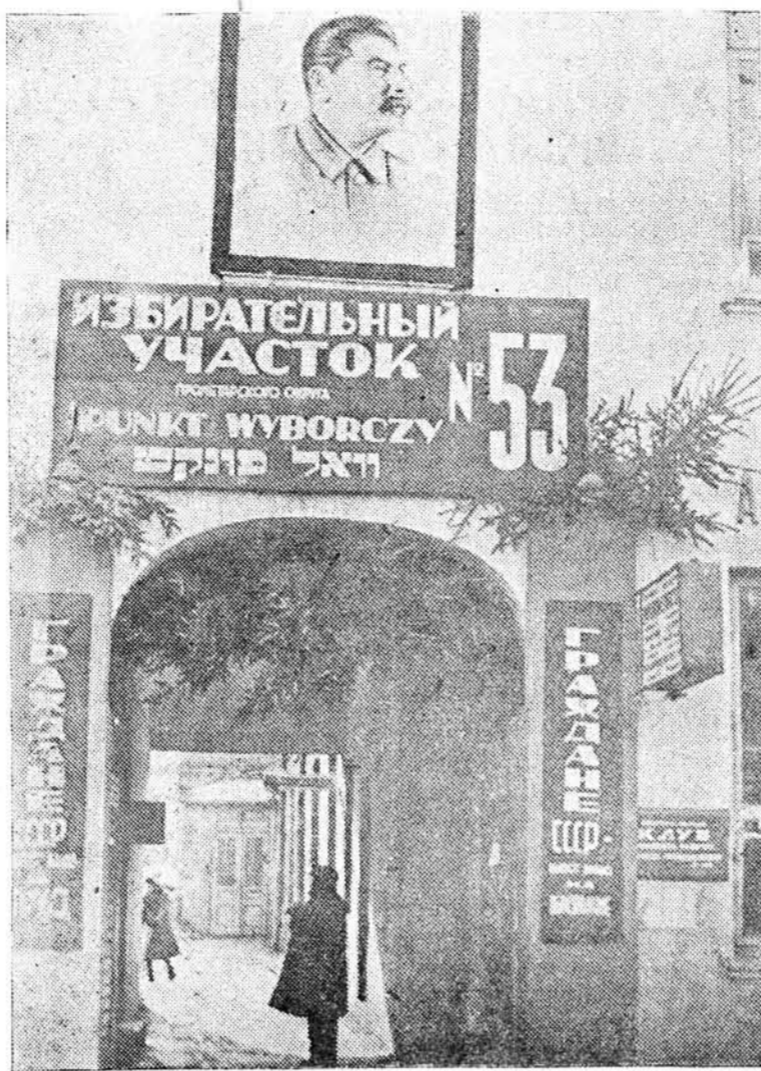
Знадворны выгляд 53-га участка, Пролетарскай выбарчай акругі.