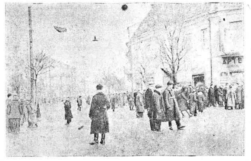
Многаладна ў вясенні дні на вуліцах Беластока.

Апрача выбараў прэзідэнта і віцэ-прэзідэнта, 5 лістапада пачынаюцца выбары палаты, прадстаўнікоў і адной трэцяй частка сената. Лідэры рэспубліканскай партыі прызнаюць, што яны не змогуць атрымаць большасць ў сенате, аднак яны ўпэўнены атрымаць большасць у палате прадстаўнікоў.