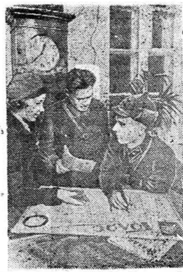
На здымку: члены выбарчага участка № 76 у Беластоку рыхтуюць чарговы нумар насценнага газета.