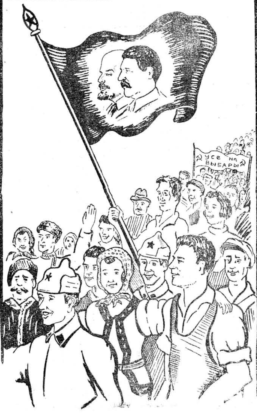
Рысунк Э. Гольдберга

№ 69 (138) Нядзеля, 24 сакавіка 1940 г. Цана 10 к. апаек