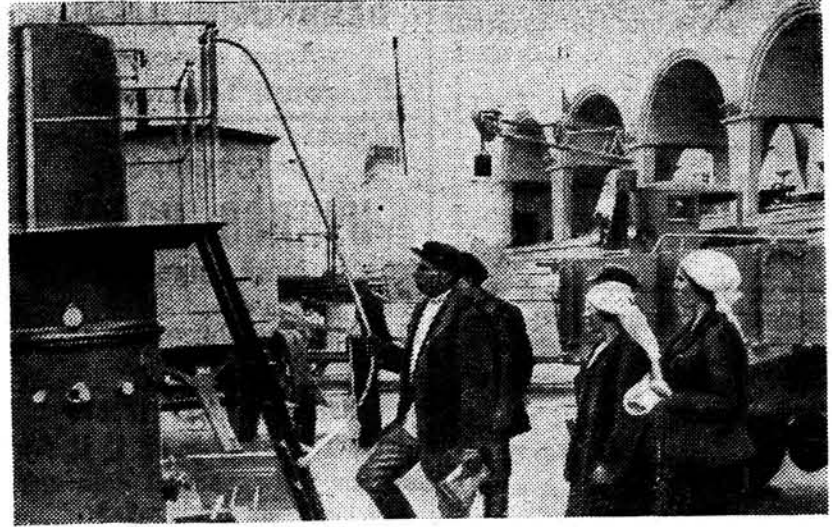
На здымку: экскурсанты ад Брышкаўскага раёна Беластоцкай абласці на Усеаюзнай сельскагаспадарчай выстаўцы ў павільёне «Механізацыя» аглядаюць сельскагаспадарчыя машыны, якімі ўзброены калгасы СССР.