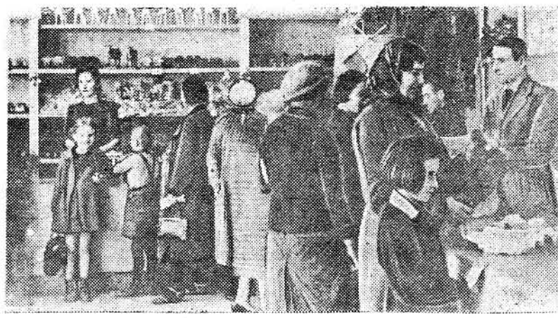
Агульны ўнутраны выгляд беластоцкага пачатнага магазіна па Совецкай вуліцы.