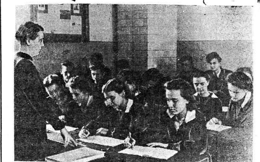
На ўроку хіміі ў 10 класе 12-й беластоцкай польскай школы. Урок вядзе настаўніца Е. І. Ламшарская.