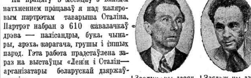
Заслужаны дзеяч мастацтваў БССР, скульптар-ордэнаносец З. І. Азгур. Фота М. Савіна. Фотахроніка БЕЛТА.

Заслужаны дзеяч мастацтваў БССР, скульптар-ордэнаносец М. А. Керзін. Фота М. Савіна. Фотахроніка БЕЛТА.