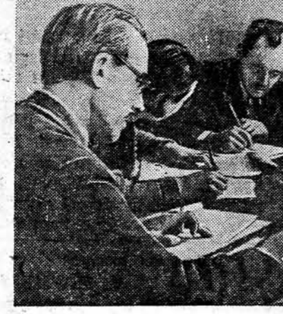
На здымку: актыў горада Гродна за складаннем спіскаў выбаршчыкаў.

— У бядой Польшчы мы не ведалі, за каго галасавалі. Кожная партыя, якіх было тут вельмі многа, падоўвала сваіх кандыдатаў, а іх агенты ўсімі сродкамі збіралі галасы. І ўсё-ж такі галасоў было