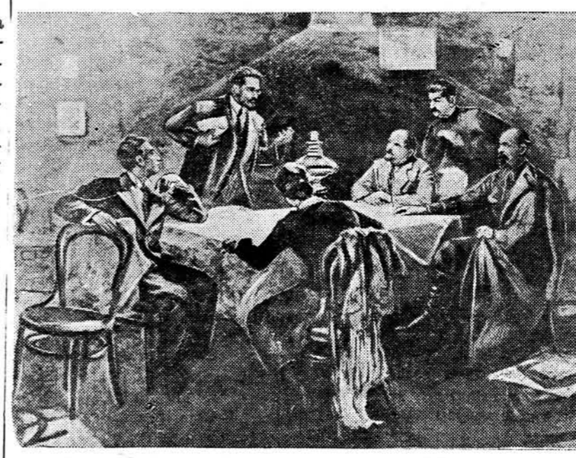
Карціна заслужанага дзеяча мастацтваў, ордэнаноца В. В. Волкава «Выступленне Я. М. Свердла на партыйным пасяджэнні ЦК партыі большэвікоў 23 (10) кастрычніка 1917 года».