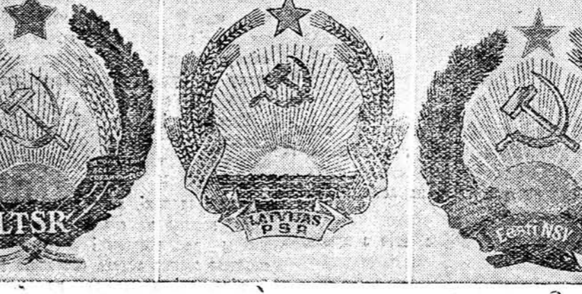
Дзяржаўны герб Літоўскай ССР. Дзяржаўны герб Латвійскай ССР. Дзяржаўны герб Эстонскай ССР.

ПРЫЎІК. Зіміні сезон палявання на пушнога зверу ў поўным разгары. У тайгу на промысел вышлі больш 10 тысяч паляўнічых Іркуцкай абласці. За першы месяц палявання забіта сотні тысяч белая і ацэтараў. Больш паспяхова, чым у мінулым годзе, ідзе паляванне на гарнастая і зайча-беляка.