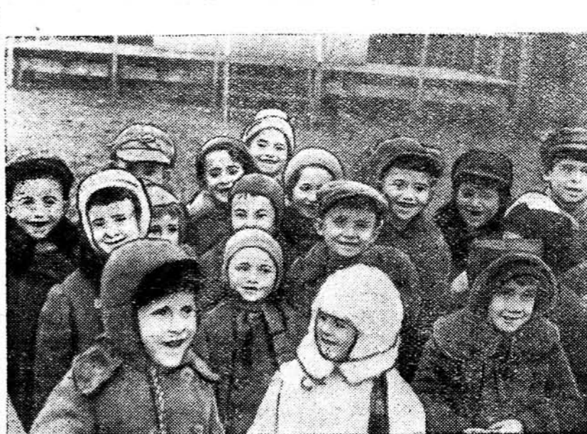
На здымку: Дзеці ў дзіцячым садзе №12 пры 2-м Беларускам тэк-

ЛОНДАН, 28 лістапада. (ТАСС). Англійская газета «Дэйлі экспрэс»