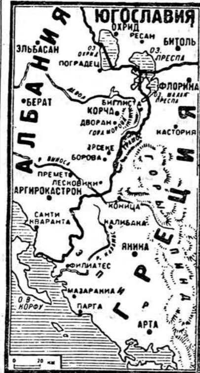
кай тэрыторыі дастатковай колькасці выгоды для Грэцыі.

Італія сканцэнтравала ў Альбаніі 9 армію ў саставе да 12 дывізій, у тым ліку адну горную і адну механізаваную, агульнай колькасцю каля 200.000 чалавек.