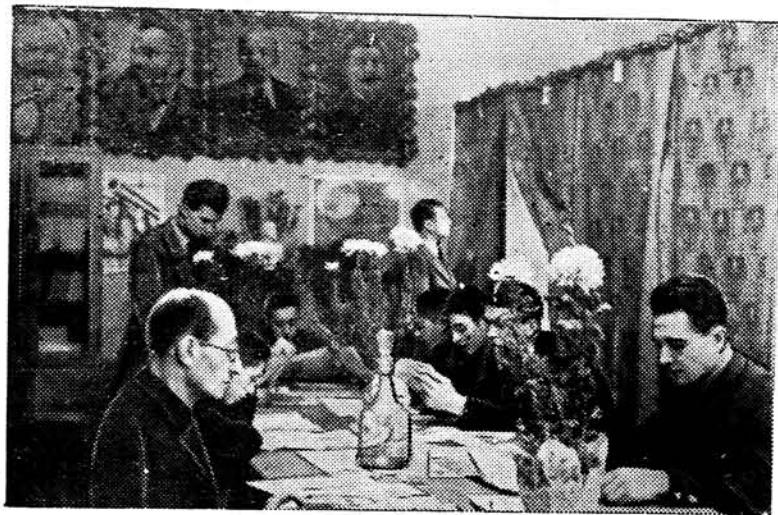
На здымку: Выбаршчыкі 6-га выбарчага ўчастка (вуліца імя Чкалава) горада Беластока ў памяшканні ўчастка чытаюць газеты і літаратуру аб выбарах.

Пярвічная партыйная арганізацыя горада ў кандыдаты партыі прыняла лепшую актывістку тав. Шпільман. У перыяд кампаніі на выбарах у Вярхоўныя Саветы СССР і БССР тав. Шпільман прапала старшынёй участкавай выбарчай камісіі. Зараз тав. Шпільман таксама актывна ўдзельнічае ў рабоце на падрыхтоўцы да выбараў у мясцовыя Саветы.