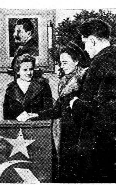
На здымку: Маладыя выбарчыкі студэнты Педінстытута галасуюць на Чырвонаармейскім выбарчым участку № 6.