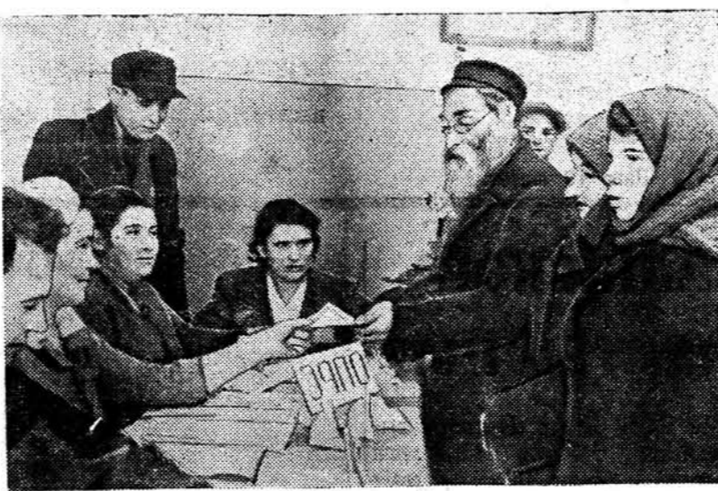
На здымку: Выдача бюлетэняў для тайнага галасавання на 5-м Мазавецкім выбарчым участку ў Беластоку.