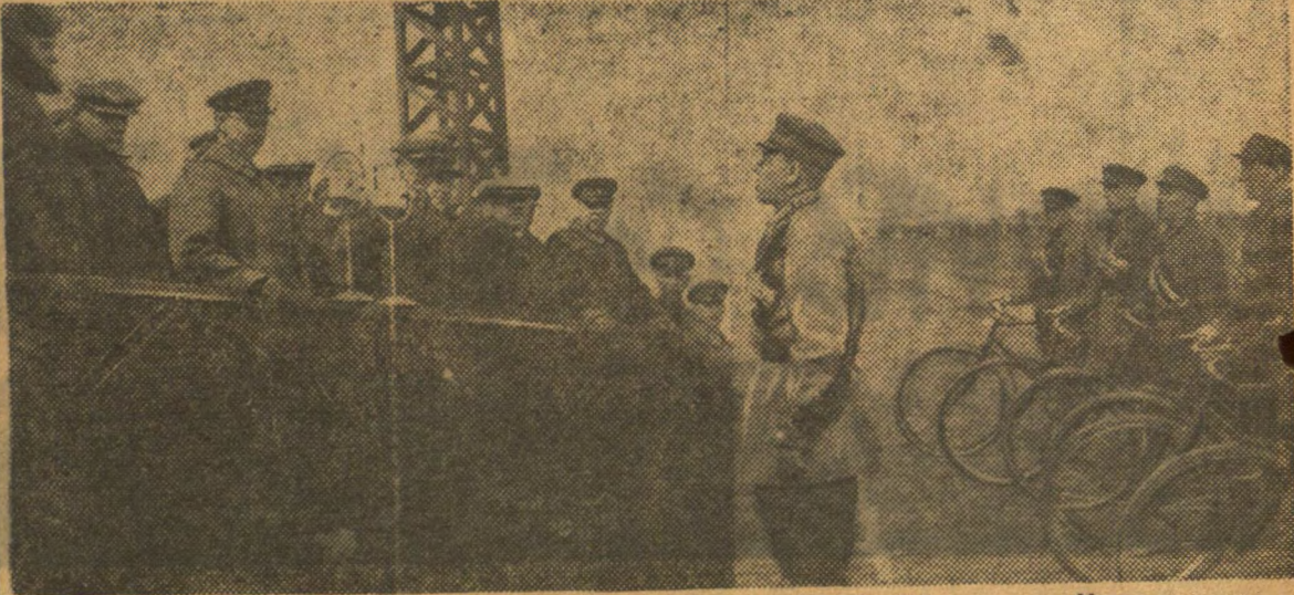
Репарт ураду БССР і каман даванню БВА ад удзельнікаў вело-прабегу Смаленск—Менск.

У заключэнне прадстаўнік французскага друку прынес віншаванне Лавалю і Пацёмкіну з шчаслівым сканчэннем перагавораў і з заключэннем дагавору.