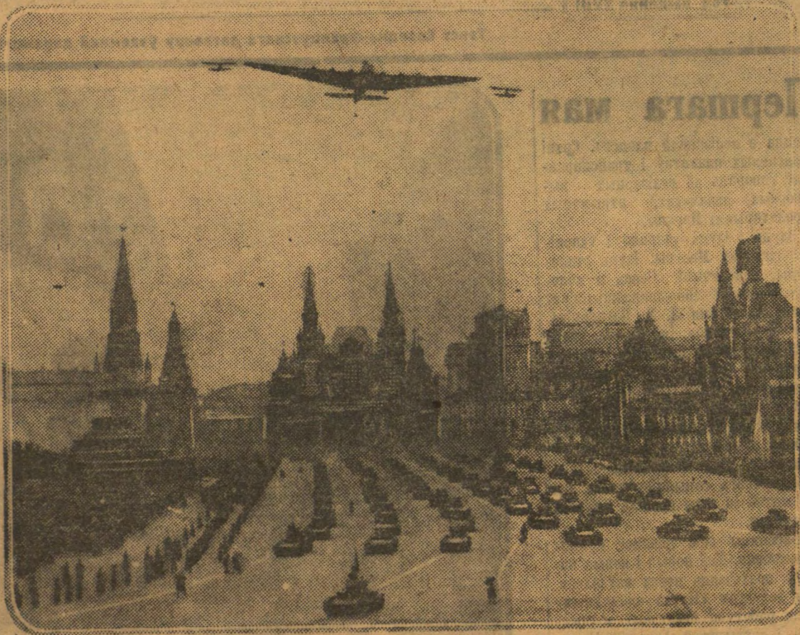
1 МАЯ ў МАСКВЕ. Самалёт-гігант «Максім Горький» і калона танкаў на парадзе.

Ідуць войскі сувязі. Зенітныя кулямёты. Праграмыкала артылерыйскіх розных размераў і калібраў. Паішлі ў сваім грацэсійным маршы конныя масы. На галоне прамаўляе кулямётны тачанні.