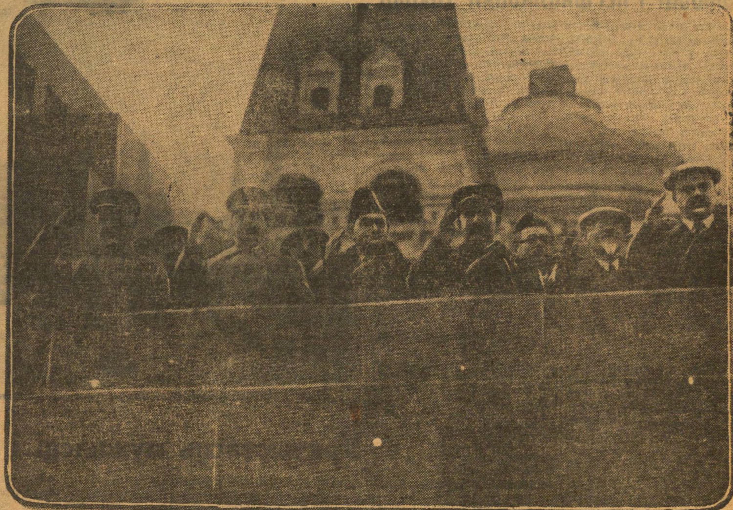
1 МАЯ У МАСКВЕ. Таварышы СТАЛІН, МОЛАТАЎ, КАГАНОВІЧ, КАЛІНІН, ОРДЖАНІКІДЗЕ, ШВЕРНІК, ДЗІМІТРАЎ, УХАНАЎ, ЯРАСЛАЎСКІ на трыбуне маўзалея Леніна.

Разам з працоўнымі чырвонай сталіцы ідзе калона гасцей — леп-шых ударнікаў калгасаў ордэна-носнай Маскоўскай вобласці. Кало-на знатных людзей — значкістаў паходу імя Кагановіча «за высокі ураджай» — адбрываецца велізар-ным ордэнам Леніна і барэльефам т. Сталіна. Залочаныя каласы хі-стаюцца над радамі. І нібы выра-жэннем агульнага настрою выра-стае над плошчаю гіганцкі транс-парат, на яым пераможна і горда-раюць словы: «Расія непераможна».