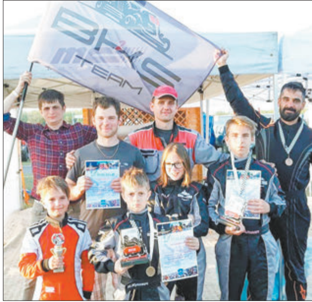
Картынг — самая масавая і папулярная аўтамабільная гончак дывізія ў свеце.

— Як і ў любой справе, галоўнае для дасягнення поспеху — перыядычнасць. Чым больш стартаў зробіш за сезон, тым больш удалых фінішаў атрымаеш. Зразумела, бываюць неспадзяваныя выпадкі нахшталь дрэннага настрою або самаадчування, якія могуць