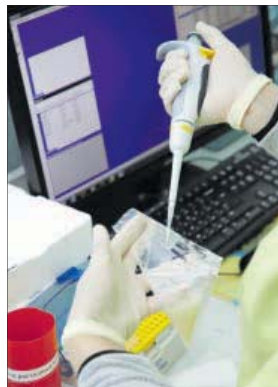
Ацэнка якасці семяпрадуктаў.