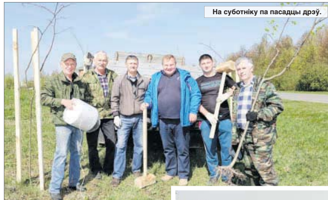
На суботніку на пасадцы дрэў.