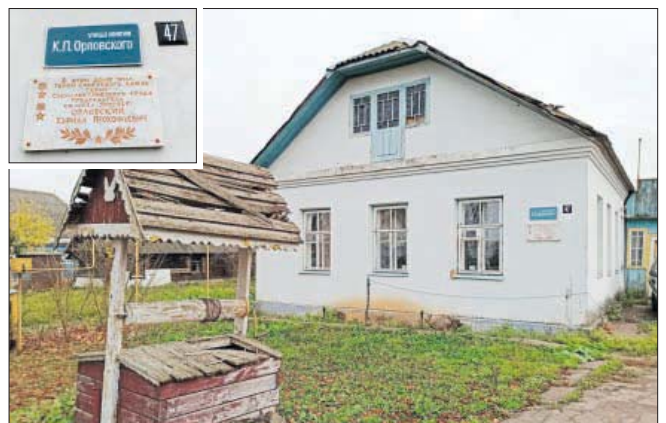
Дом, дзе Кірыла Арлоўскі правёў апошнія гады свайго жыцця.