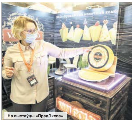
На выстаўцы «ПрадЭкспа».

кі пакупнік шукае на паліцах магазінаў і нязменна аддае ім перавагу. Гэта можна сказаць пра ААТ «Савушкін прадукт».