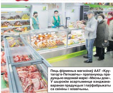
Пяць фірменных магазінаў ААТ «Крутагор'е-Петкавічы» прапануюць прадукцыю вядомай маркі «Мясны дом». У шырокім асартымеце вэнджаная варяная прадукцыя і паўфабрыкаты са свінніны і ялавічыны.