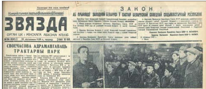
У нумары «Звязды» за 16 лістапада 1939 года, які захаваўся ў Нацыянальнай бібліятэцы, Закон «Аб прыяцці Заходняй Беларусі ў састав БССР» быў апублікаваны на самым бачным месцы — на першай старонцы побач з «шапкай».

— Пытанне ўвогуле вельмі неадзначанае, на мой погляд. Растлумачу, чаму. Паводле дагавора паміж урадамі СССР і Літоўскай Рэспублікі ад 10 кастрычніка 1939 года. Віленя і Віленская вобласць агульнай плошчай 6900 км 2 , дзе большасць насельніцтва складалі беларусы, былі перададзены Літве. Такім чынам, фактычна адбыліся дзеянні, якія прывялі