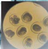
Эмбрыёны буйной рагатай жывёлы.