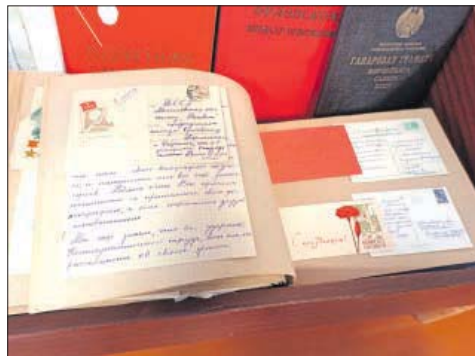
Кірыла Арлоўскаму пісалі з усіх канцоў свету.

да жніўня 1943-га Кірыла Арлоўскі паспяхова кіраваў буйным партызанскім атрадам «Сокалы», які дзейнічаў на тэрыторыі Баранавіцкай вобласці. У лютым 1943-га атрад пад яго камандаваннем здзейсніў напад на канвой Генеральнага камісара Беларускай Вільгельма Кубэ. Але Кубэ сярэд немцаў не аказалася. І хоць з атрада Арлоўскага ніхто не загінуў, сам ён быў цяжка паранены — у руках разарвалася звязка толу. Прышлось у паллявых умовах ампутаваць правую руку і чатыры пальцы на левай. Рэзалі пілоў па жывым, замест анестэзіі даўшы шклянку самагонку. Узрывам камандзіру моцна пашкодзіла яшчэ і сляхавы нерв. Да бальнай службы Арлоўскі быў ужо непрыгодны, і ў жніўні 1943-га яго адклікалі ў Маскву.