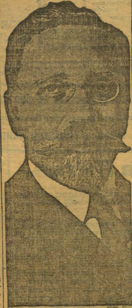
Л. Б. КАМЕНЕВ.

И поэтому нам нужно всю эту новую массу прежде, чем принять в партию, провести через ту школу коммунизма, которую представляют наши общественные организации. Работа в заводах, в организациях пролетарской общественности, в секциях советов, участие в кампаниях, прохождение через кружки и школы политграмоты, словом, через все подготовительные ступени к пролетарскому авангарду, через беспартийный актив к передовому рабочему отряду — вот пути, ведущие рабочего в партию.