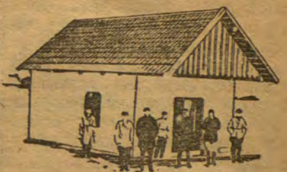
Глино-хворостяная постройка с черепичной крышей.

Бредит получает также и население на приобретение огнестойких материалов и огнестойкое строительство: на постройку двора 250 руб., на черепичную крышу — 130