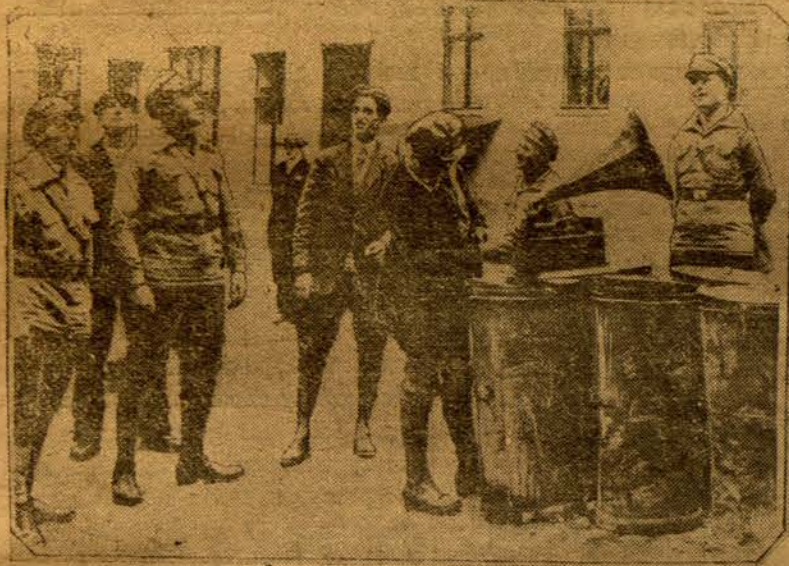
На здымку — група агітатараў саюзу чырвоных франтавіноў аднаўляе на грамафонна на дварох рабочых кварталаў выбарчую прамову нямецкай кампарты.