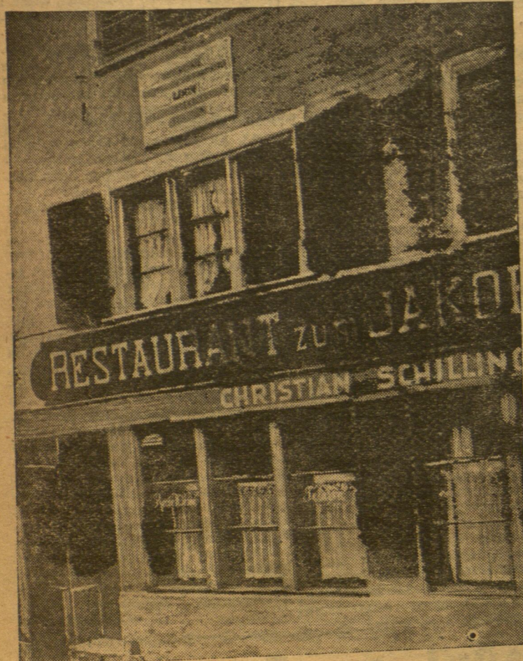
На здымку—дом, дзе жыў Ленін, з памятнай дошкай.