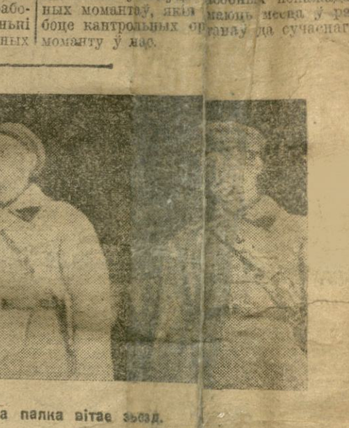
Дэлегацыя №-га палка вітае зьезд.