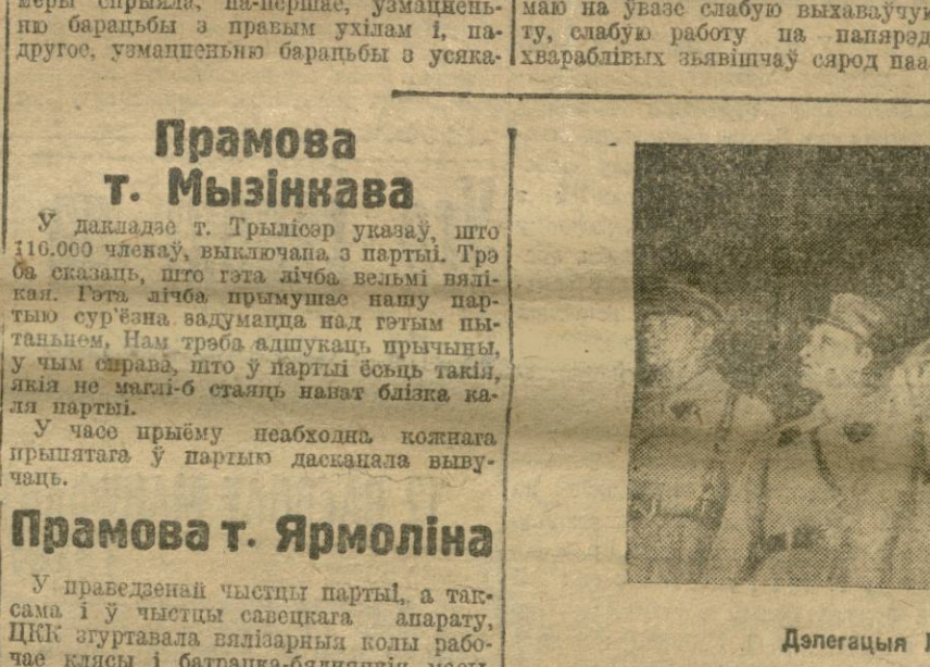
Дэлегацыя №-га палка вітае зьезд.