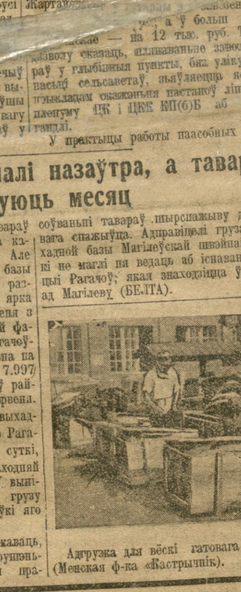
Адгружа для вёскі гатовы адвешыя (Месекан ф-на «Вострыні»).