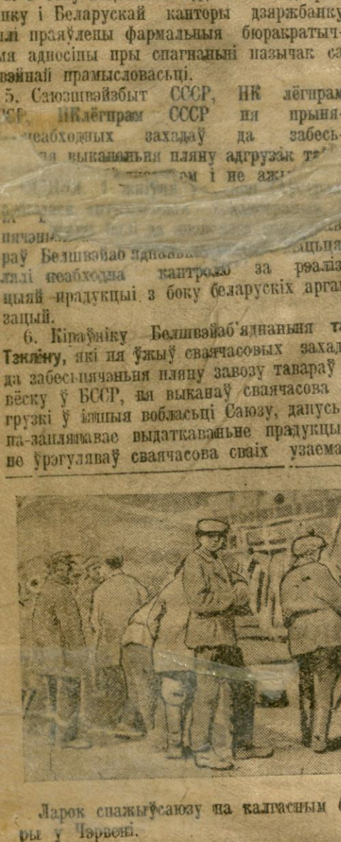
Ларок снажыўсаву на калгасным базары ў Чэрвені.

У Барысаўскім раёне пасляпохадга працаваць зборачнай машынай вялікую ролю адыгрывае наладжванне таваразавозу і харчавання рабочых саўгасу і калгасу. Асабліва значэнне ў гэтых адносінах мае арганізацыя грамадзкага харчавання на палёх.