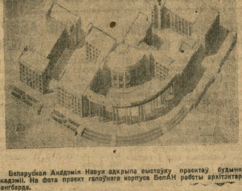
Беларуская Акадэмія Навук адкрыла выставку праектаў будынка Акадэміі. На фота праект галоўнага корпусу БелАН работы архітэктара Лангбарда.