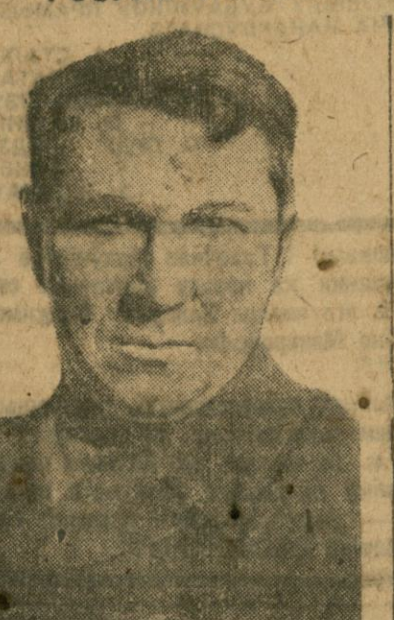
Інструктар ЦК КП(б)Б