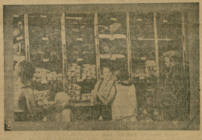
Гэтымі днямі ў Менску на Ленінскай вуліцы адкрыўся...