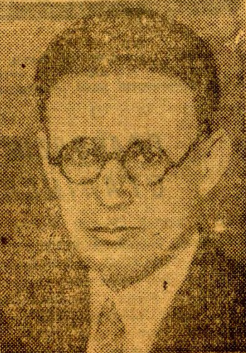
Чэмпіён СССР МІХ. БАТВІНІК.